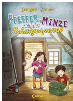
Pfeffer, Minze und das Schulgespenst