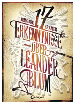
17 Erkenntnisse über Leander Blum