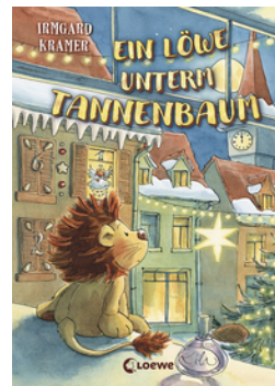
Ein Löwe unterm Tannenbaum