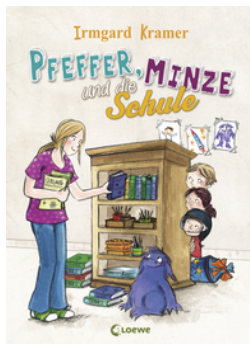
Pfeffer, Minze und die Schule