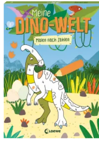
Meine Dino-Welt - Malen nach Zahlen Taschenbuch