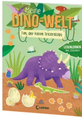
Meine Dino-Welt - Tim, der kleine Triceratops Taschenbuch