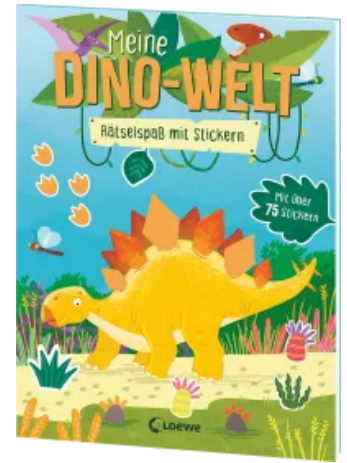
Meine Dino-Welt - Rätselspaß mit Stickern Taschenbuch