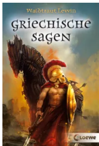
Griechische Sagen Taschenbuch