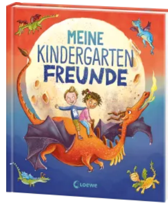
Meine Kindergarten- Freunde (Drachen) Hardcover