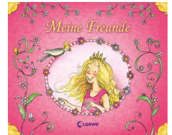
Meine Freunde (Prinzessin) Unbekannt