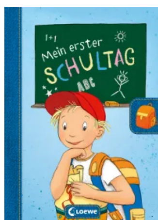
Mein erster Schultag - Jungen Hardcover