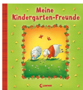
Meine Kindergarten- Freunde (Schafe)