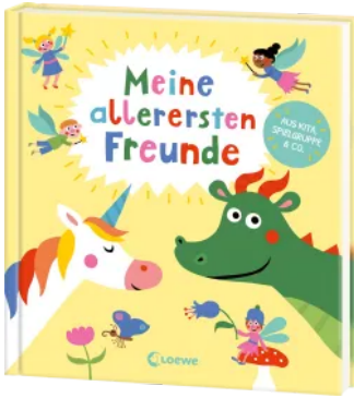
Meine allerersten Freunde (Fabelwesen) Hardcover