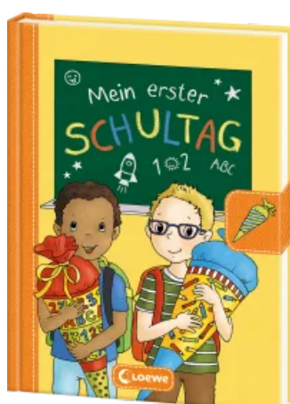
Mein erster Schultag - Jungs (Gelb) Hardcover