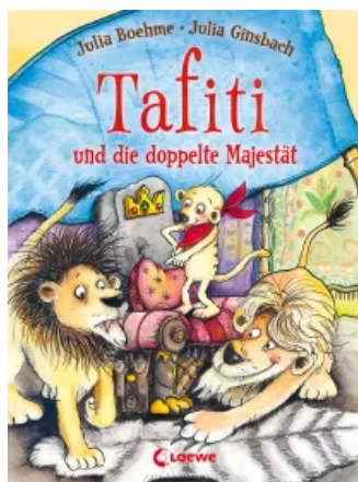
Tafiti und die doppelte Majestät (Band 9)