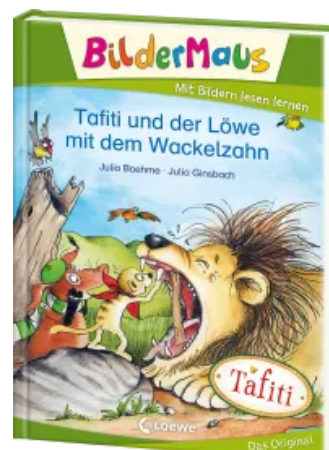
Bildermaus - Tafiti und der Löwe mit dem Wackelzahn