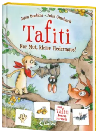
Tafiti - Nur Mut, kleine Fledermaus!