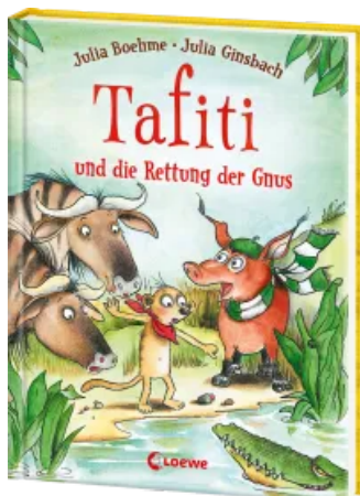
Tafiti und die Rettung der Gnus (Band 16)