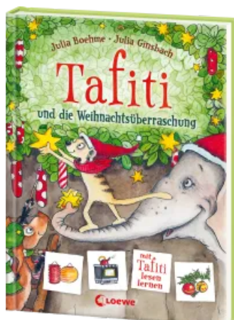
Tafiti und die Weihnachtsüberraschung