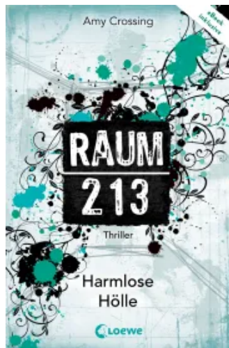
Raum 213 – Harmlose Hölle Paperback