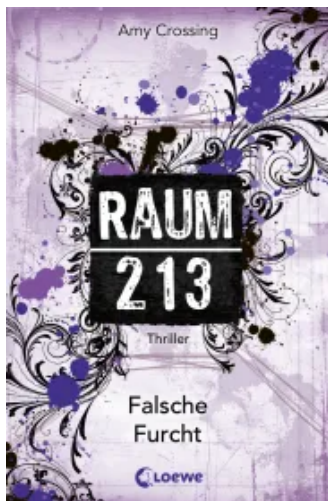
Raum 213 (Band 4) – Falsche Furcht Paperback