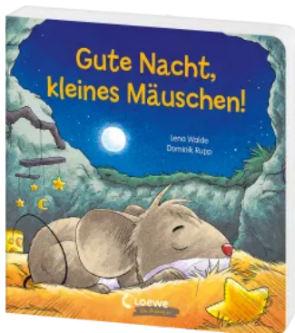
Gute Nacht, kleines Mäuschen! Hardcover