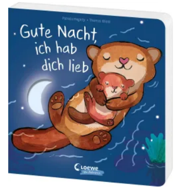
Gute Nacht, ich hab dich lieb Hardcover