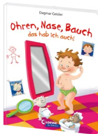
Ohren, Nase, Bauch - das hab ich auch! Hardcover