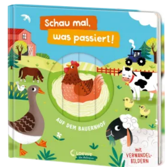
Schau mal, was passiert! Auf dem Bauernhof Hardcover