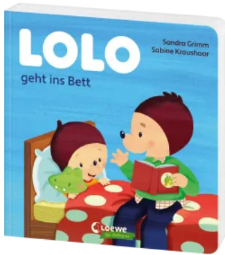
Lolo geht ins Bett Hardcover