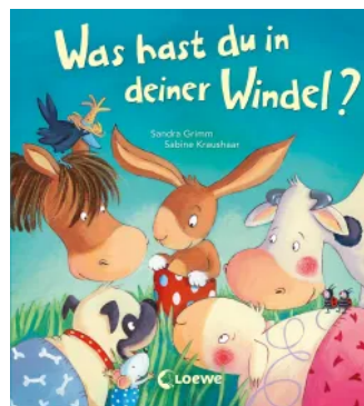
Was hast du in deiner Windel? Hardcover