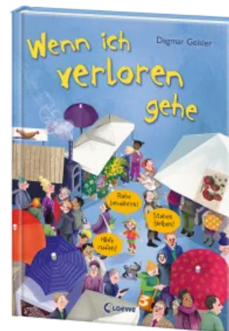
Wenn ich verloren gehe (Starke Kinder, glückliche Eltern) Hardcover