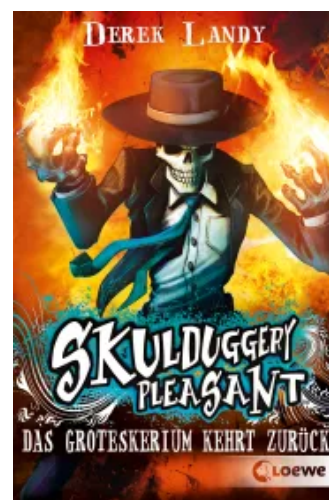
Skulduggery Pleasant (Band 2) - Das Groteskerium kehrt zurück Taschenbuch