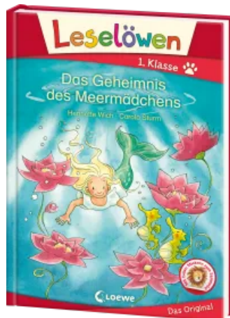
Leselöwen 1. Klasse - Das Geheimnis des Meermädchens Hardcover