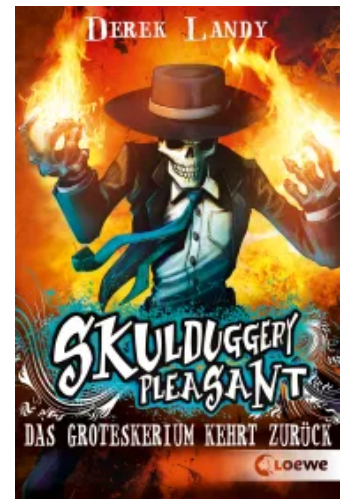
Skulduggery Pleasant (Band 2) - Das Groteskerium kehrt zurück Taschenbuch