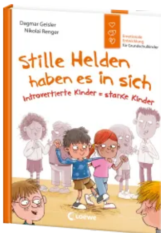
Stille Helden haben es in sich (Starke Kinder, glückliche Eltern) Hardcover