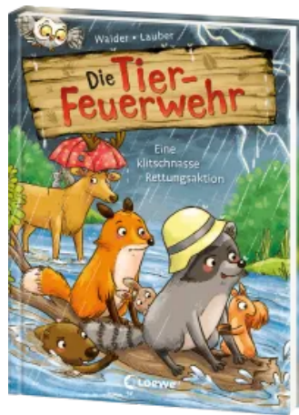
Die Tier-Feuerwehr (Band 2) - Eine klitschnasse Rettungsaktion Hardcover