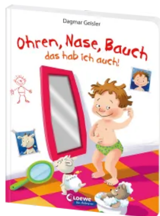
Ohren, Nase, Bauch - das hab ich auch! Hardcover