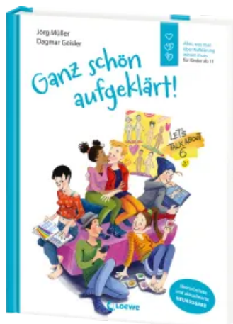
Ganz schön aufgeklärt! Hardcover