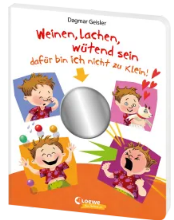
Weinen, lachen, wütend sein - dafür bin ich nicht zu klein! Hardcover