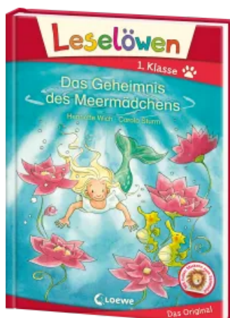
Leselöwen 1. Klasse - Das Geheimnis des Meermädchens Hardcover