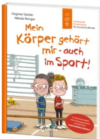
Mein Körper gehört mir - auch im Sport! (Starke Kinder, glückliche Eltern) Hardcover