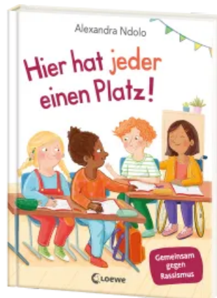
Hier hat jeder einen Platz! Hardcover