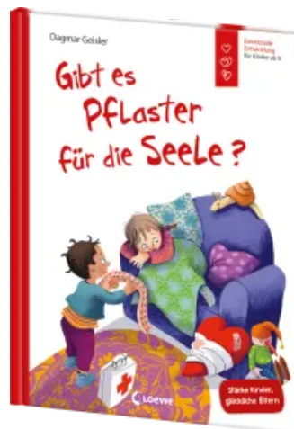
Gibt es Pflaster für die Seele? (Starke Kinder, glückliche Eltern) Hardcover