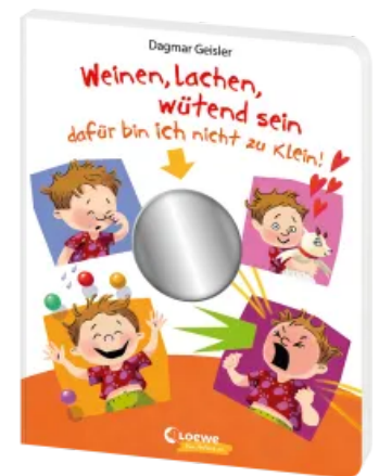
Weinen, lachen, wütend sein - dafür bin ich nicht zu klein! Hardcover