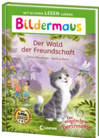
Bildermaus - Der Wald der Freundschaft Hardcover