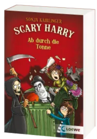
Scary Harry (Band 4) - Ab durch die Tonne Taschenbuch