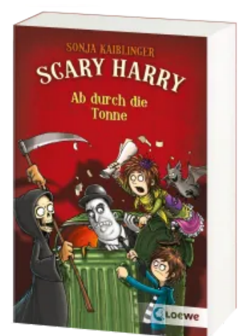
Scary Harry (Band 4) - Ab durch die Tonne Taschenbuch