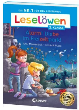
Leselöwen 2. Klasse - Alarm! Diebe im Freizeitpark! Taschenbuch