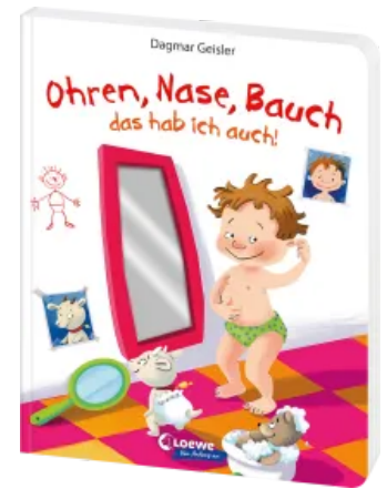
Ohren, Nase, Bauch - das hab ich auch! Hardcover