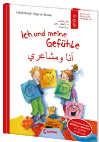
Ich und meine Gefühle - Deutsch - Arabisch (Starke Kinder, glückliche Eltern) Hardcover