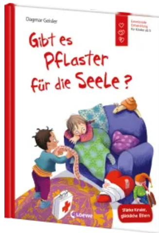
Gibt es Pflaster für die Seele? (Starke Kinder, glückliche Eltern) Hardcover