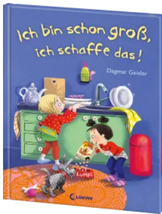
Ich bin schon groß, ich schaffe das! Hardcover