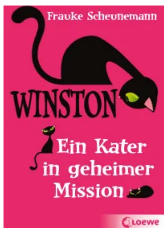
Winston (Band 1) - Ein Kater in geheimer Mission Taschenbuch