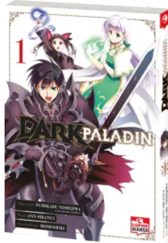
Dark Paladin 01 Taschenbuch