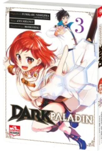
Dark Paladin 03 Taschenbuch