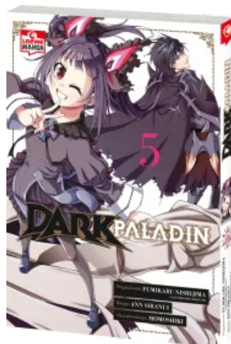
Dark Paladin 05 Taschenbuch