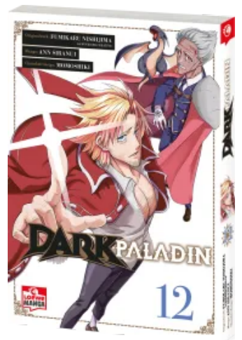
Dark Paladin 12 Taschenbuch