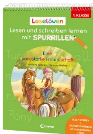
Leselöwen - Lesen und schreiben lernen mit Spurrillen - Eine ponystarke Freundschaft Taschenbuch