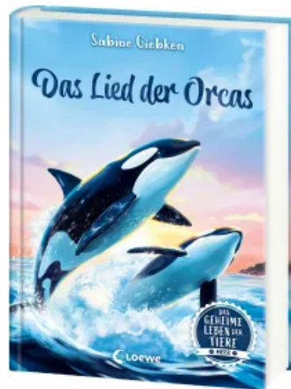
Das geheime Leben der Tiere (Meer) - Das Lied der Orcas Hardcover