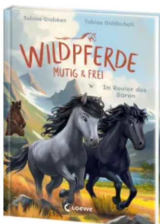
Wildpferde - mutig und frei (Band 6) - Im Revier des Bären Hardcover