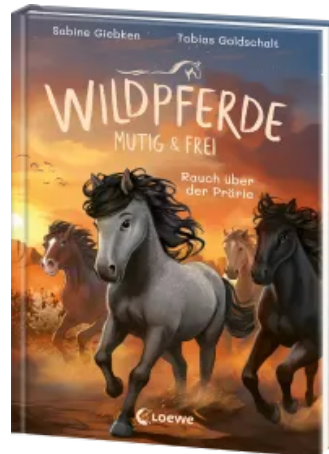
Wildpferde - mutig und frei (Band 5) - Rauch über der Prärie Hardcover