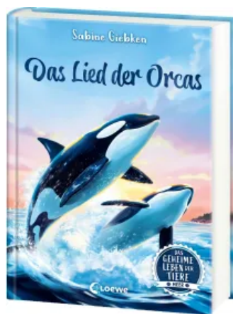
Das geheime Leben der Tiere (Meer) - Das Lied der Orcas Hardcover