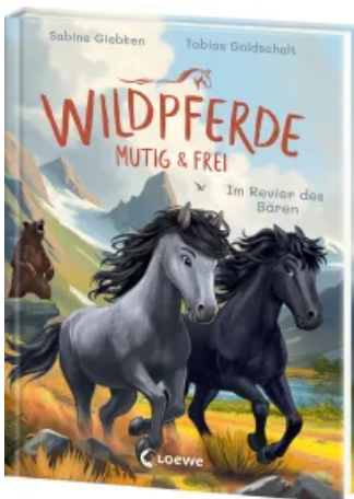
Wildpferde - mutig und frei (Band 6) - Im Revier des Bären Hardcover