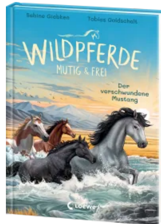
Wildpferde - mutig und frei (Band 4) - Der verschwundene Mustang Hardcover