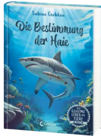
Das geheime Leben der Tiere (Meer) - Die Bestimmung der Haie Hardcover