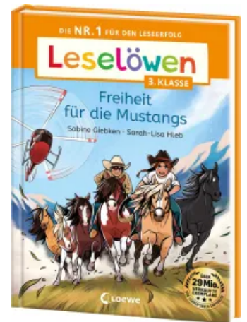
Leselöwen 3. Klasse - Freiheit für die Mustangs Hardcover