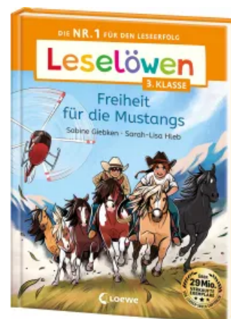
Leselöwen 3. Klasse - Freiheit für die Mustangs Hardcover