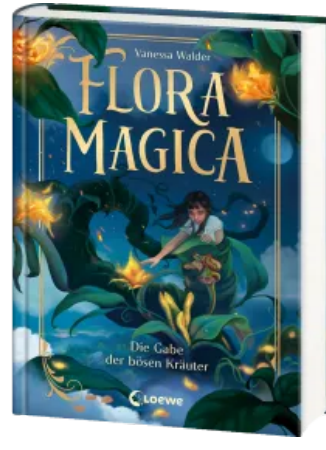
Flora Magica (Band 2) - Die Gabe der bösen Kräuter Hardcover