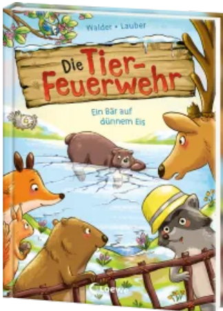
Die Tier-Feuerwehr (Band 3) - Ein Bär auf dünnem Eis Hardcover