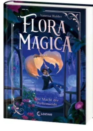
Flora Magica (Band 3) - Die Macht der Weltenweide Hardcover