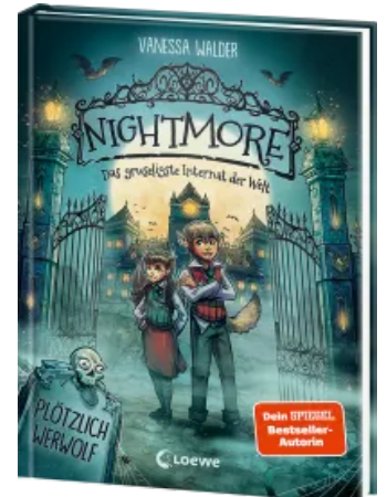
Nightmore - Das gruseligste Internat der Welt (Band 1) - Plötzlich Werwolf Hardcover