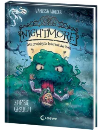
Nightmore - Das gruseligste Internat der Welt (Band 2) - Zombie gesucht Hardcover