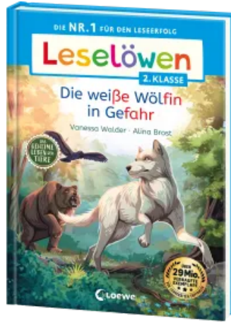
Leselöwen 2. Klasse - Das geheime Leben der Tiere - Die weiße Wölfin in Gefahr Hardcover