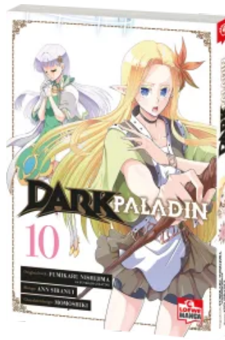
Dark Paladin 10 Taschenbuch