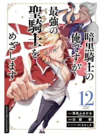
Dark Paladin 12 Taschenbuch