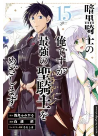
Dark Paladin 15 Taschenbuch