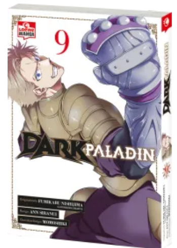
Dark Paladin 09 Taschenbuch