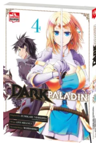
Dark Paladin 04 Taschenbuch