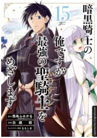
Dark Paladin 15 Taschenbuch