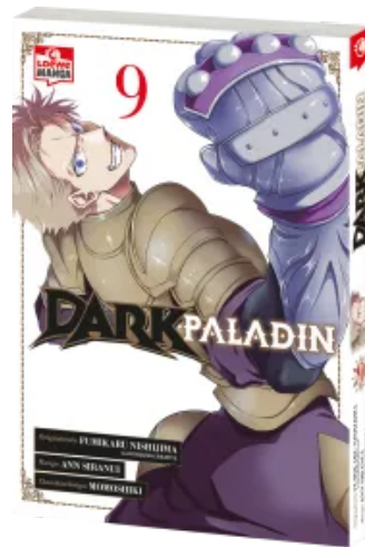
Dark Paladin 09 Taschenbuch