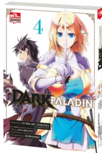
Dark Paladin 04 Taschenbuch