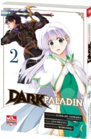
Dark Paladin 02 Taschenbuch