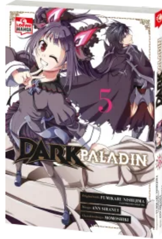
Dark Paladin 05 Taschenbuch