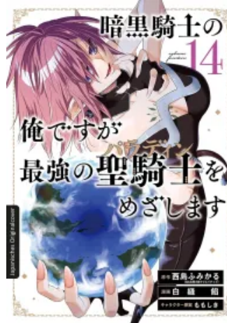
Dark Paladin 14 Taschenbuch