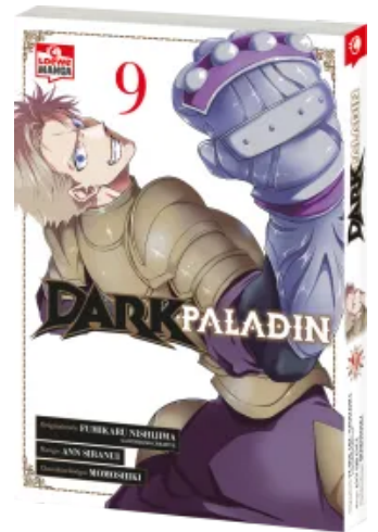
Dark Paladin 09 Taschenbuch