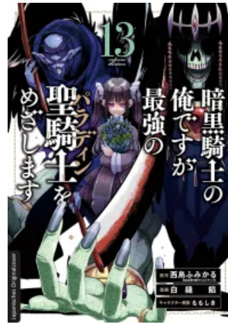
Dark Paladin 13 Taschenbuch