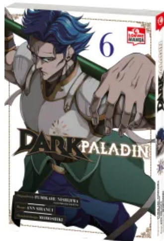
Dark Paladin 06 Taschenbuch