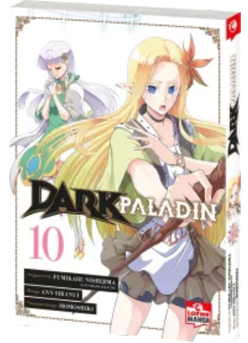
Dark Paladin 10 Taschenbuch