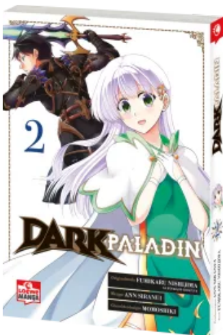
Dark Paladin 02 Taschenbuch