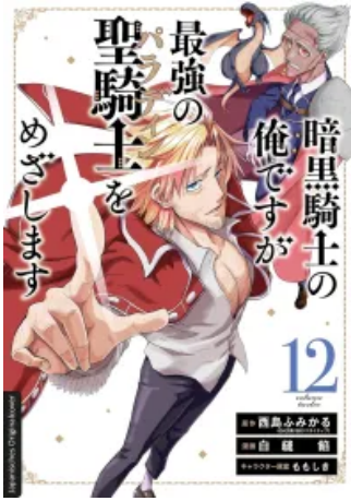
Dark Paladin 12 Taschenbuch