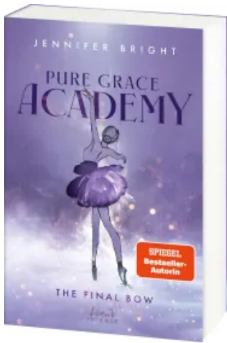
Pure Grace Academy (Band 1) - The Final Bow Paperback