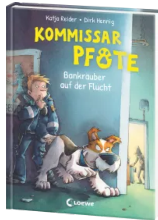
Kommissar Pfote (Band 10) - Bankräuber auf der Flucht Hardcover