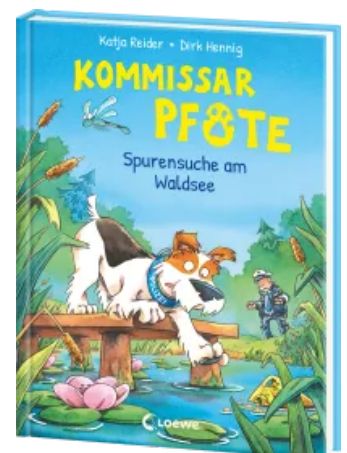
Kommissar Pfote (Band 7) - Spurensuche am Waldsee Hardcover