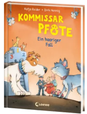
Kommissar Pfote (Band 4) - Ein haariger Fall Hardcover