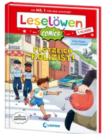
Leselöwen Comics 1. Klasse - Plötzlich Polizist! Hardcover