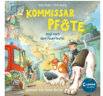
Kommissar Pfote (Band 8) - Jagd nach dem Feuerteufel Hörbuch