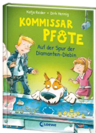
Kommissar Pfote (Band 2) - Auf der Spur der Diamanten-Diebin Hardcover