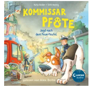
Kommissar Pfote (Band 8) - Jagd nach dem Feuerteufel Hörbuch