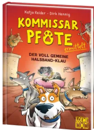
Kommissar Pfote ermittelt (Band 2) - Der voll gemeine Halsband-Klau Hardcover