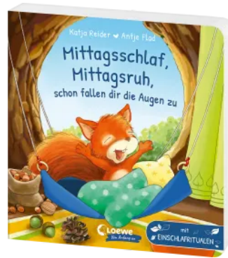
Mittagsschlaf, Mittagsruhe, schon fallen dir die Augen zu Hardcover