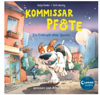
Kommissar Pfote (Band 6) - Ein Einbruch ohne Spuren Hörbuch