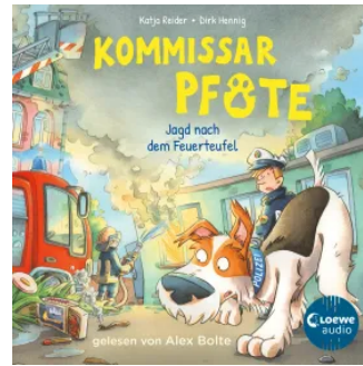
Kommissar Pfote (Band 8) - Jagd nach dem Feuerteufel Hörbuch