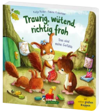
Traurig, wütend, richtig froh - das sind meine Gefühle Hardcover