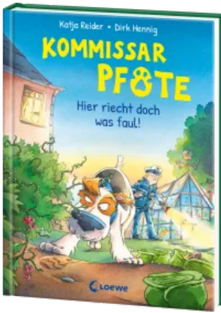
Kommissar Pfote (Band 5) - Hier riecht doch was faul! Hardcover