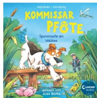
Kommissar Pfote (Band 7) - Spurensuche am Waldsee Hörbuch