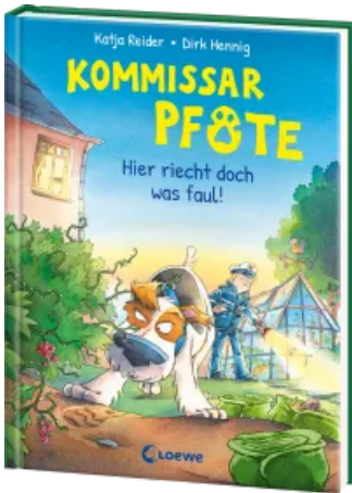
Kommissar Pfote (Band 5) - Hier riecht doch was faul! Hardcover