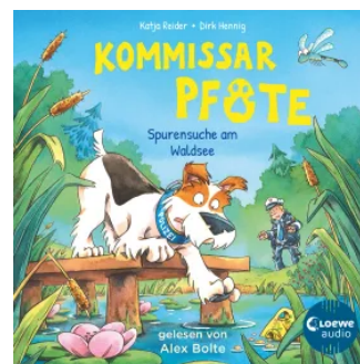
Kommissar Pfote (Band 7) - Spurensuche am Waldsee Hörbuch