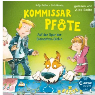
Kommissar Pfote (Band 2) - Auf der Spur der Diamanten-Diebin Hörbuch