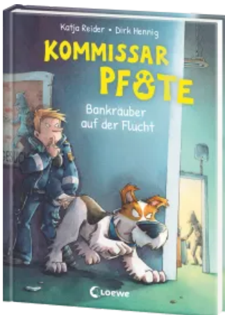
Kommissar Pfote (Band 10) - Bankräuber auf der Flucht Hardcover