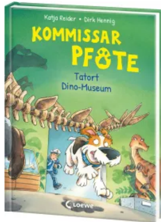
Kommissar Pfote (Band 9) - Tatort Dino-Museum Hardcover