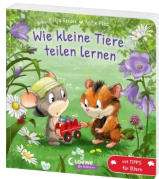
Wie kleine Tiere teilen lernen Hardcover