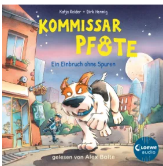
Kommissar Pfote (Band 6) - Ein Einbruch ohne Spuren Hörbuch