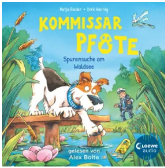
Kommissar Pfote (Band 7) - Spurensuche am Waldsee Hörbuch