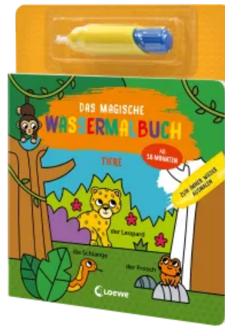
Das magische Wassermalbuch - Tiere Hardcover