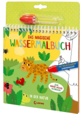
Das magische Wassermalbuch - In der Natur Hardcover