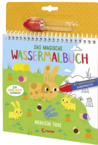
Das magische Wassermalbuch - Niedliche Tiere Hardcover