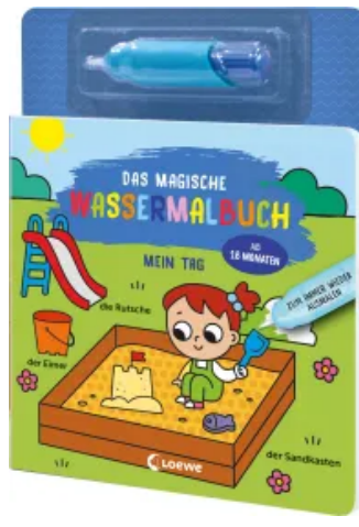
Das magische Wassermalbuch - Mein Tag Hardcover