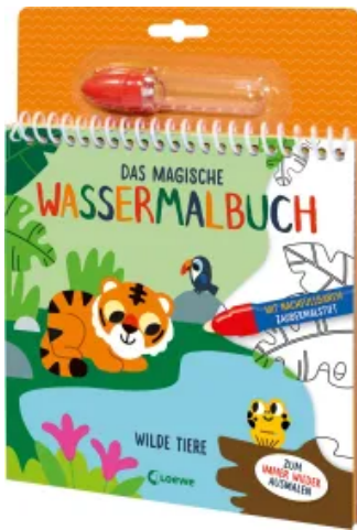
Das magische Wassermalbuch - Wilde Tiere Hardcover