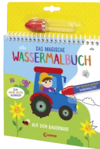
Das magische Wassermalbuch - Auf dem Bauernhof Hardcover