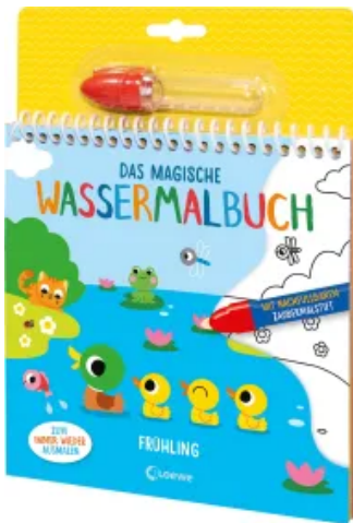
Das magische Wassermalbuch - Frühling Hardcover