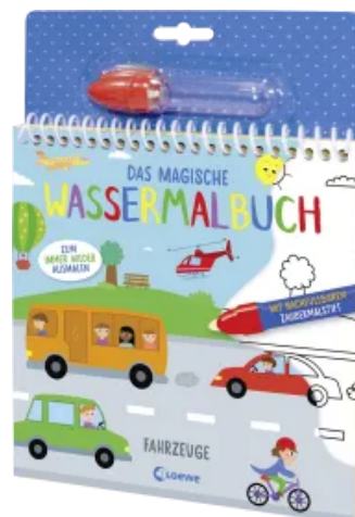
Das magische Wassermalbuch - Fahrzeuge Hardcover