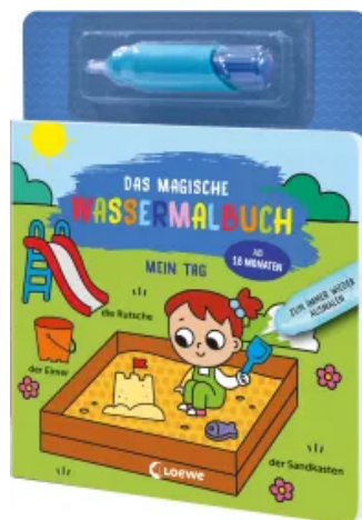
Das magische Wassermalbuch - Mein Tag Hardcover