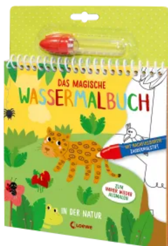
Das magische Wassermalbuch - In der Natur Hardcover