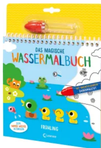
Das magische Wassermalbuch - Frühling Hardcover