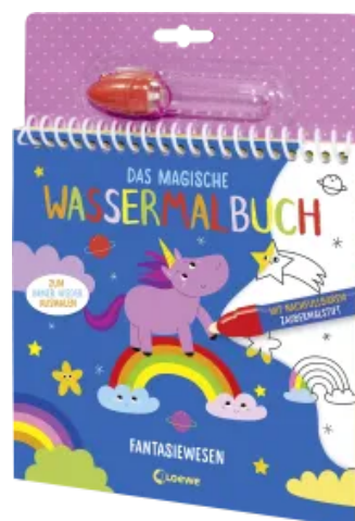
Das magische Wassermalbuch - Fantasiewesen Hardcover