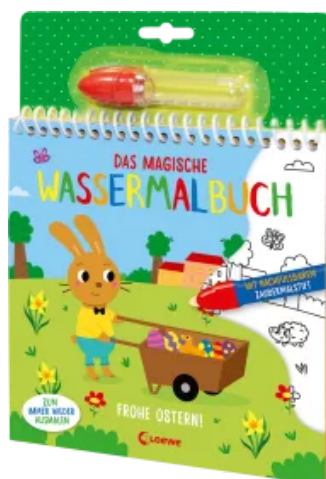
Das magische Wassermalbuch - Frohe Ostern! Hardcover