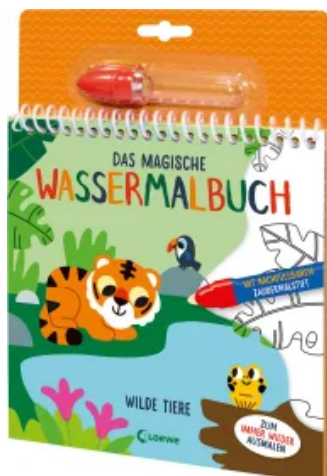
Das magische Wassermalbuch - Wilde Tiere Hardcover