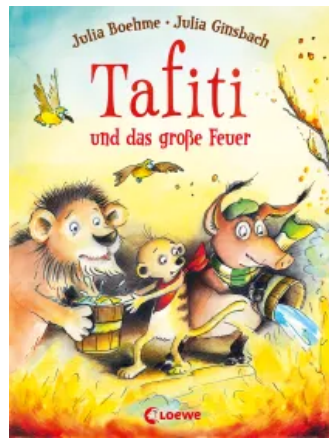
Tafiti und das große Feuer (Band 8) Hardcover