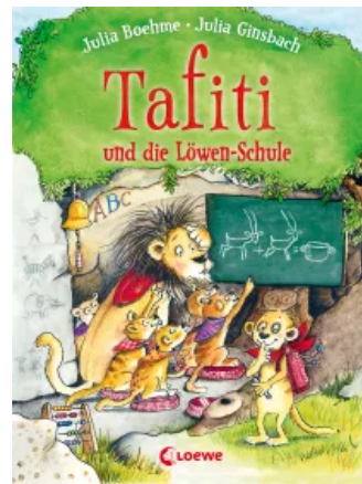
Tafiti und die Löwen- Schule (Band 12) Hardcover