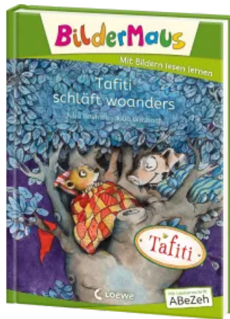
Bildermaus - Tafiti schläft woanders Hardcover