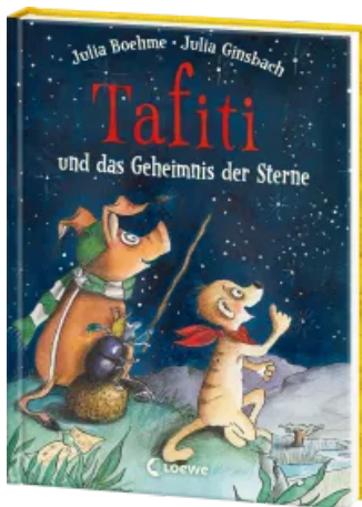
Tafiti und das Geheimnis der Sterne (Band 14) Hardcover