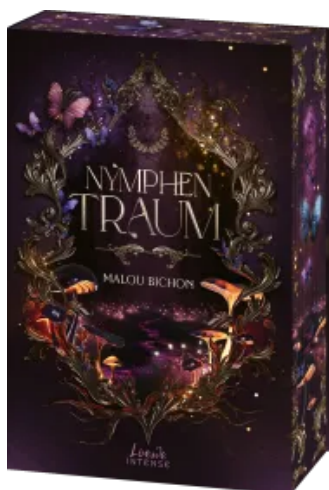
Nymphentraum (Nektar und Ambrosia, Band 2) Paperback