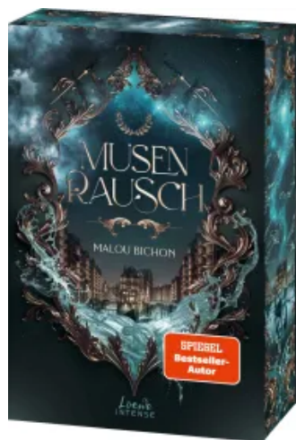
Musenrausch (Nektar und Ambrosia, Band 1)