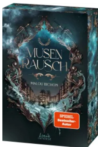
Musenrausch (Nektar und Ambrosia, Band 1) Paperback