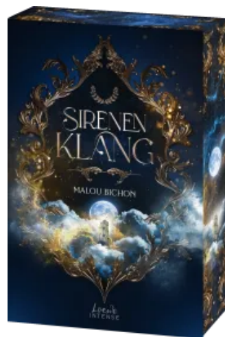
Sirenenklang (Nektar und Ambrosia, Band 3)