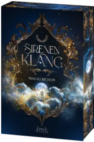
Sirenenklang (Nektar und Ambrosia, Band 3) Paperback