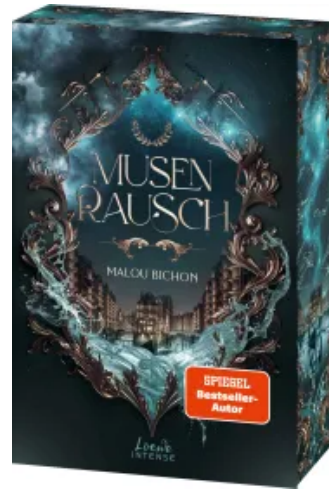
Musenrausch (Nektar und Ambrosia, Band 1)