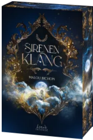
Sirenenklang (Nektar und Ambrosia, Band 3)