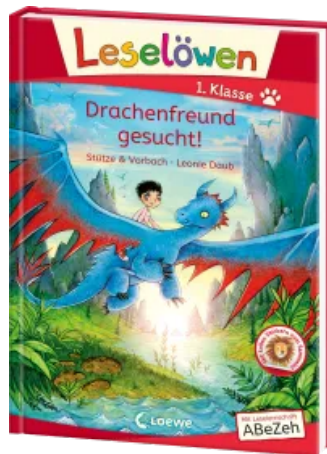
Leselöwen 1. Klasse - Drachenfreund gesucht! Hardcover