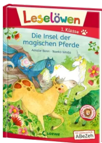
Leselöwen 1. Klasse - Die Insel der magischen Pferde Hardcover