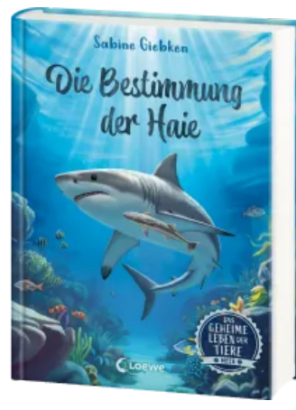
Das geheime Leben der Tiere (Meer) - Die Bestimmung der Haie Hardcover