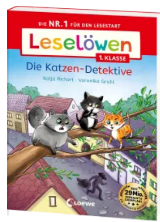
Leselöwen 1. Klasse - Die Katzen-Detektive Taschenbuch