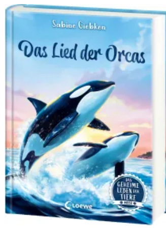
Das geheime Leben der Tiere (Meer) - Das Lied der Orcas Hardcover