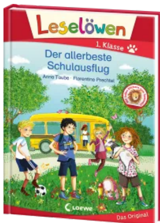
Leselöwen 1. Klasse - Der allerbeste Schulausflug Hardcover