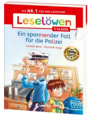
Leselöwen 1. Klasse - Ein spannender Fall für die Polizei Taschenbuch