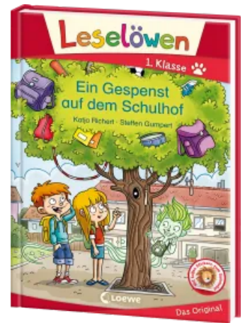
Leselöwen 1. Klasse - Ein Gespenst auf dem Schulhof Hardcover