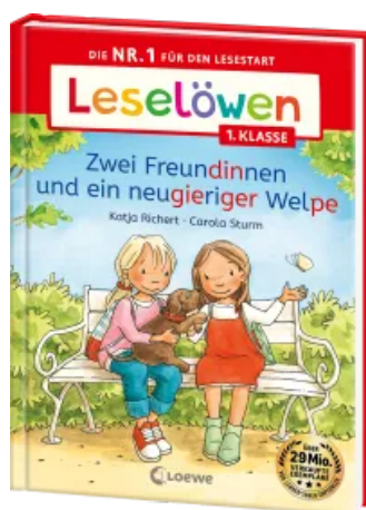
Leselöwen 1. Klasse - Zwei Freundinnen und ein neugieriger Welp Hardcover