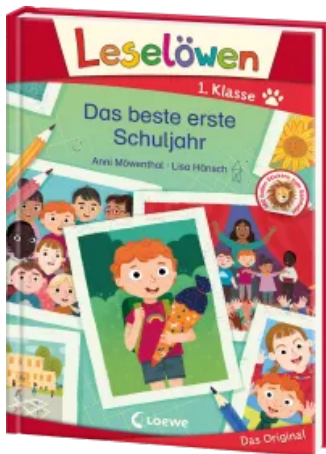
Leselöwen 1. Klasse - Das beste erste Schuljahr Hardcover