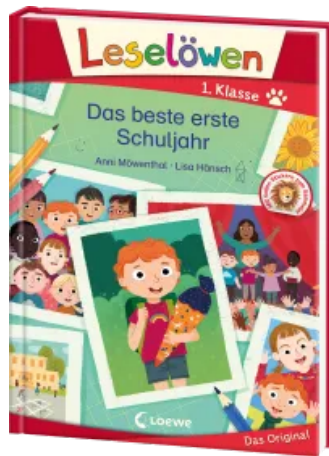
Leselöwen 1. Klasse - Das beste erste Schuljahr Hardcover