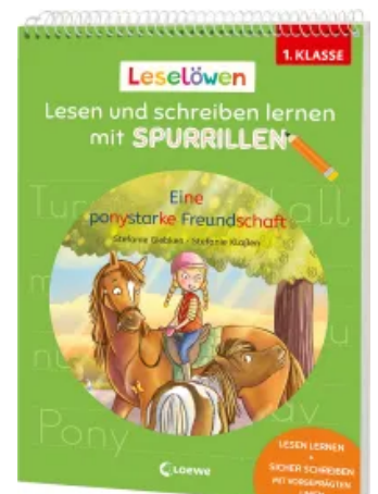
Leselöwen - Lesen und schreiben lernen mit Spurrillen - Eine ponystarke Freundschaft Taschenbuch