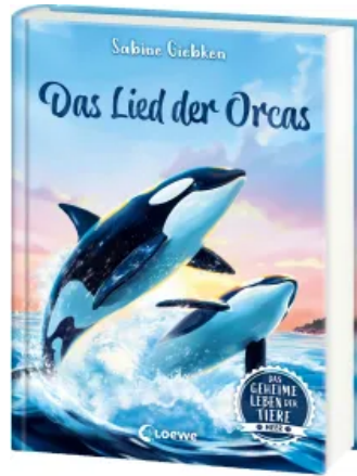
Das geheime Leben der Tiere (Meer) - Das Lied der Orcas Hardcover