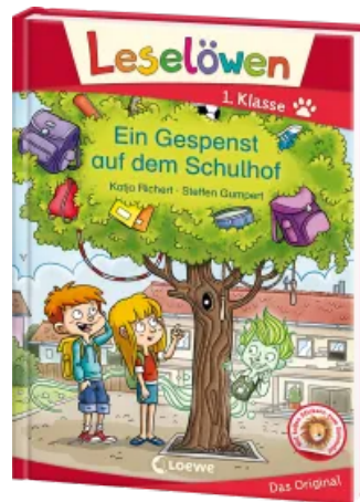
Leselöwen 1. Klasse - Ein Gespenst auf dem Schulhof Hardcover