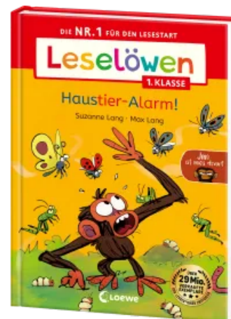
Leselöwen 1. Klasse - Jim ist mies drauf - Haustier-Alarm! Hardcover