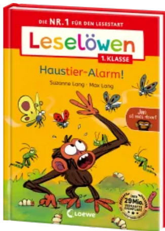
Leselöwen 1. Klasse - Jim ist mies drauf - Haustier-Alarm! Hardcover