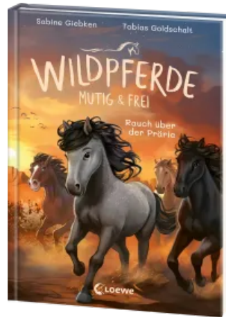
Wildpferde - mutig und frei (Band 5) - Rauch über der Prärie Hardcover