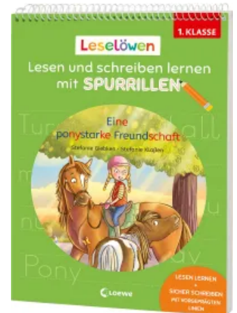
Leselöwen - Lesen und schreiben lernen mit Spurrillen - Eine ponystarke Freundschaft Taschenbuch