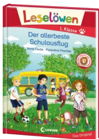
Leselöwen 1. Klasse - Der allerbeste Schulausflug Hardcover