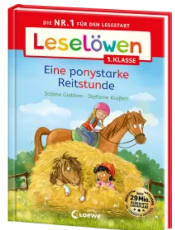
Leselöwen 1. Klasse - Eine ponystarke Reitstunde Hardcover