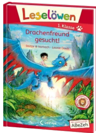
Leselöwen 1. Klasse - Drachenfreund gesucht! Hardcover