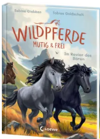
Wildpferde - mutig und frei (Band 6) - Im Revier des Bären Hardcover