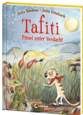
Tafiti (Band 22) - Pinsel unter Verdacht Hardcover