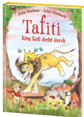
Tafiti - King Kofi dreht durch (Band 21) Hardcover