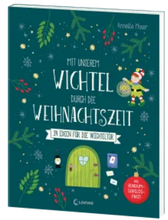
Mit unserem Wichtel durch die Weihnachtszeit Taschenbuch