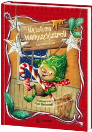
Na toll, ein Weihnachtstroll (Band 1) Hardcover