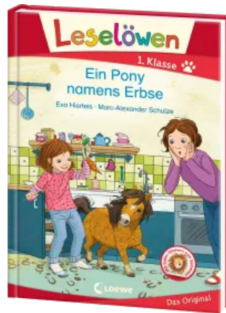
Leselöwen 1. Klasse - Ein Pony namens Erbse Hardcover