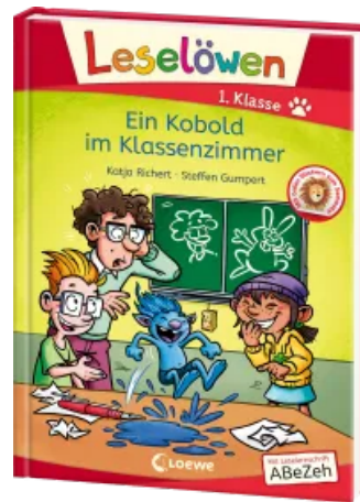
Leselöwen 1. Klasse - Ein Kobold im Klassenzimmer Hardcover