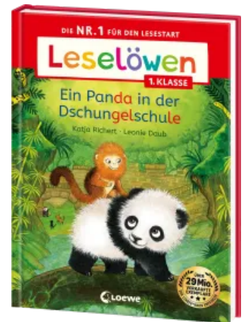
Leselöwen 1. Klasse - Ein Panda in der Dschungelschule Hardcover