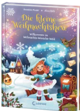
Die kleine Weihnachtshexe (Band 1) - Willkommen im Weihnachts-Wünsche-Wald Hardcover