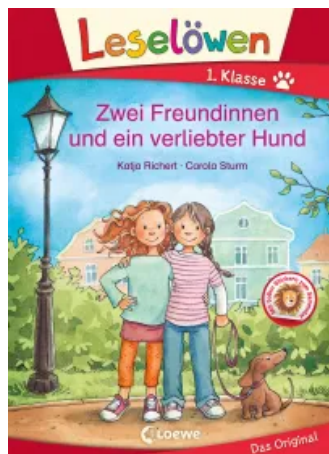
Leselöwen 1. Klasse - Zwei Freundinnen und ein verliebter Hund Hardcover