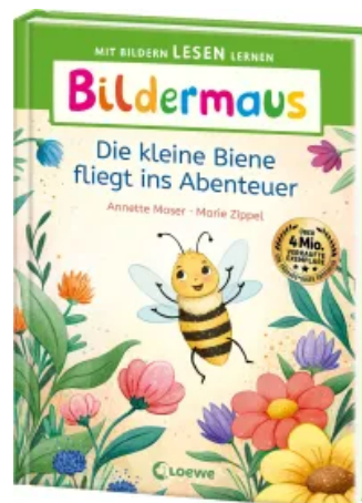
Bildermaus - Die kleine Biene fliegt ins Abenteuer Hardcover