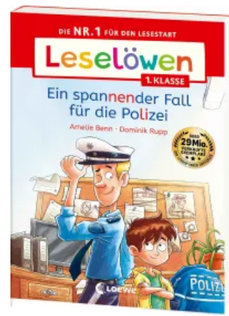
Leselöwen 1. Klasse - Ein spannender Fall für die Polizei Taschenbuch