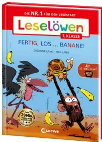
Leselöwen 1. Klasse - Jim ist mies drauf - Fertig, los ... Banane! (Großbuchstaben) Hardcover