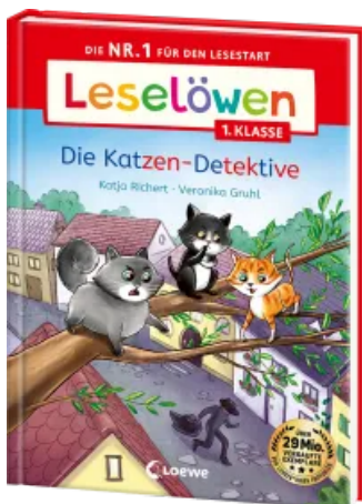
Leselöwen 1. Klasse - Die Katzen-Detektive Hardcover