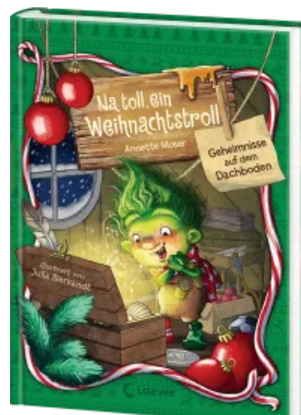
Na toll, ein Weihnachtstroll (Band 2) - Geheimnisse auf dem Dachboden Hardcover