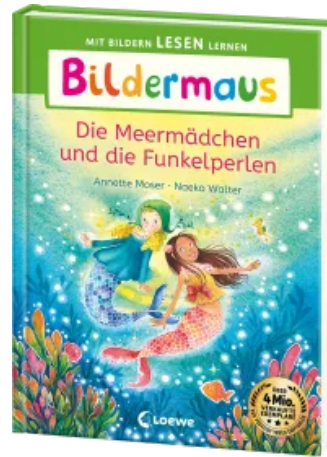
Bildermaus - Die Meeremädchen und die Funkelperlen Hardcover