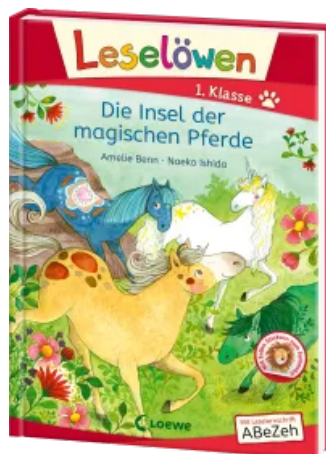
Leselöwen 1. Klasse - Die Insel der magischen Pferde Hardcover