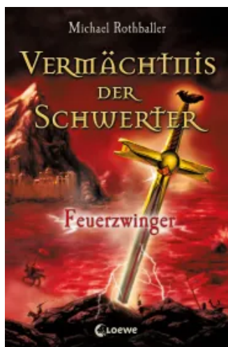
Feuerzwinger (Band 2)