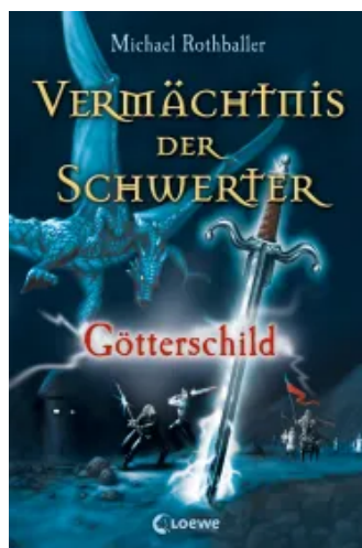
Götterschild (Band 3)