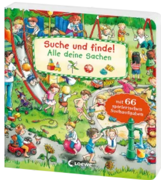
Suche und finde! - Alle deine Sachen Hardcover