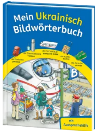
Mein Ukrainisch Bildwörterbuch Hardcover