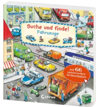
Suche und finde! - Fahrzeuge Hardcover