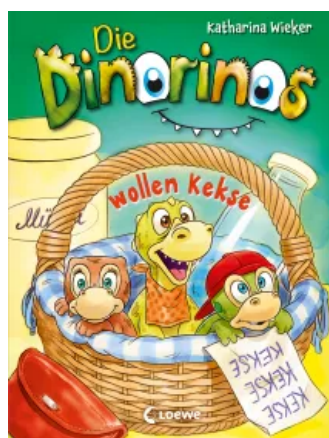
Die Dinorinos wollen Kekse (Band 2) Hardcover