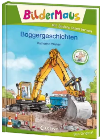
Bildermaus - Baggergeschichten Hardcover