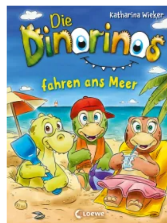
Die Dinorinos fahren ans Meer (Band 4) Hardcover