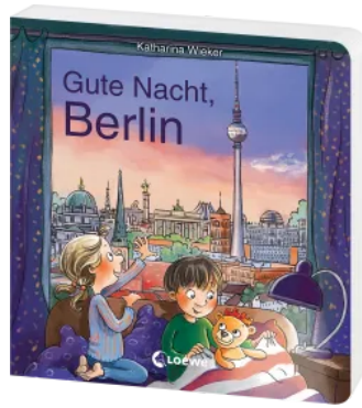
Gute Nacht, Berlin Hardcover