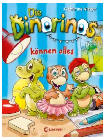
Die Dinorinos können alles (Band 1) Hardcover