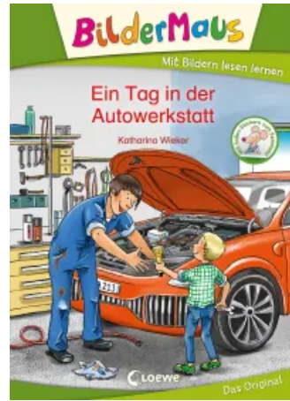
Bildermaus - Ein Tag in der Autowerkstatt Hardcover