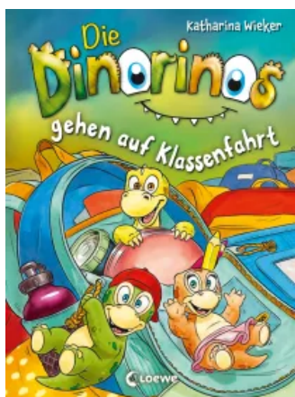
Die Dinorinos gehen auf Klassenfahrt (Band 5) Hardcover