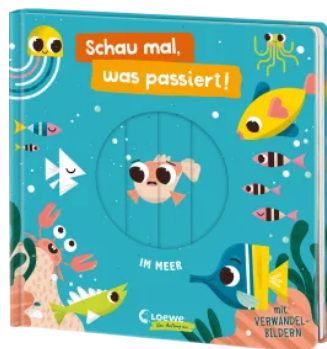
Schau mal, was passiert! Im Meer Hardcover