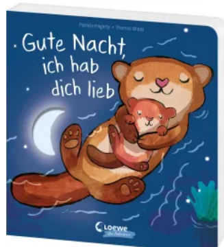
Gute Nacht, ich hab dich lieb Hardcover