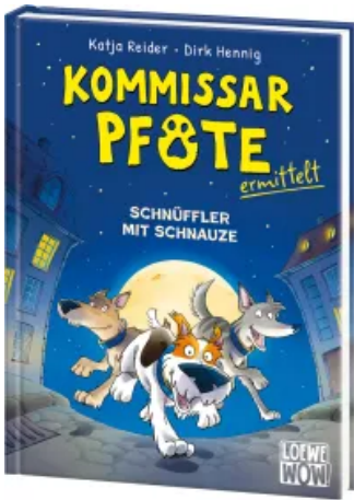
Kommissar Pfote ermittelt (Band 1) - Schnüffler mit Schnauze Hardcover