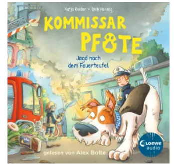
Kommissar Pfote (Band 8) - Jagd nach dem Feuerteufel Hörbuch