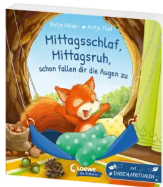
Mittagsschlaf, Mittagsruh, schon fallen dir die Augen zu Hardcover