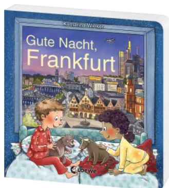
Gute Nacht, Frankfurt Hardcover