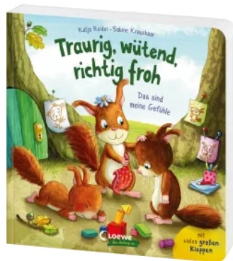
Traurig, wütend, richtig froh - das sind meine Gefühle Hardcover