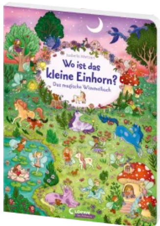
Wo ist das kleine Einhorn? Hardcover