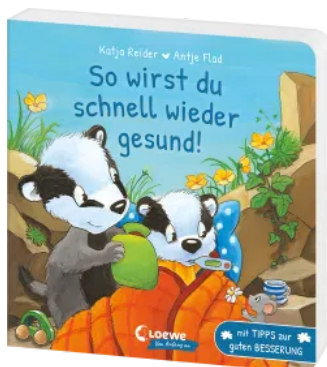
So wirst du schnell wieder gesund! Hardcover