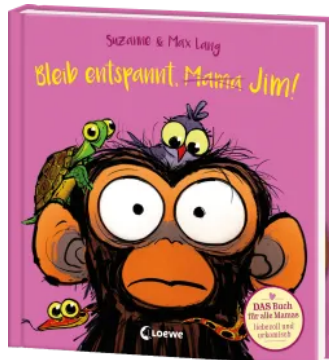
Bleib entspannt, Mama Jim! Hardcover