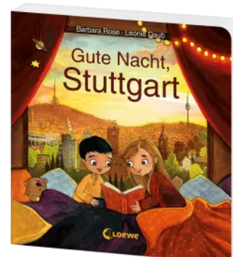
Gute Nacht, Stuttgart Hardcover