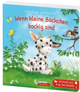
Wenn kleine Böckchen bockig sind Hardcover