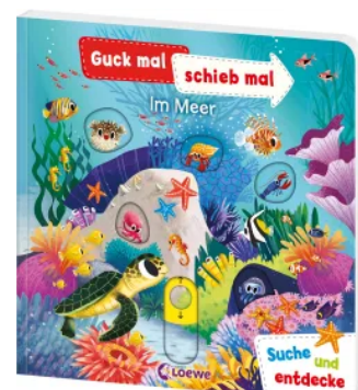
Guck mal, schieb mal! Suche und entdecke - Im Meer Hardcover