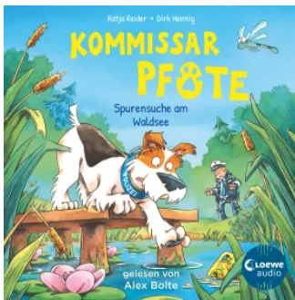
Kommissar Pfote (Band 7) - Spurensuche am Waldsee Hörbuch