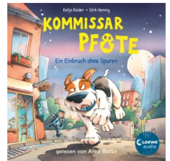
Kommissar Pfote (Band 6) - Ein Einbruch ohne Spuren Hörbuch