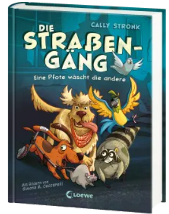
Die Straßengäng (Band 1) - Eine Pfote wäscht die andere Hardcover