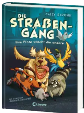
Die Straßengäng (Band 1) - Eine Pfote wäscht die andere Hardcover