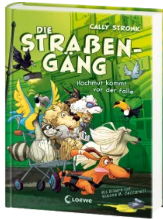
Die Straßengäng (Band 3) - Hochmut kommt vor der Falle Hardcover