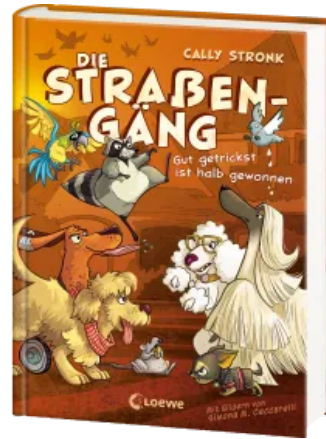
Die Straßengäng (Band 2) - Gut getrickst ist halb gewonnen Hardcover