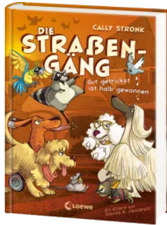
Die Straßengäng (Band 2) - Gut getrickst ist halb gewonnen Hardcover