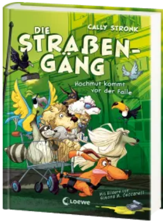
Die Straßengäng (Band 3) - Hochmut kommt vor der Falle Hardcover