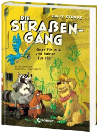
Die Straßengäng (Band 4) - Einer für alle und keiner für Flo? Hardcover