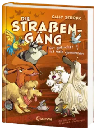
Die Straßengäng (Band 2) - Gut getrickst ist halb gewonnen Hardcover