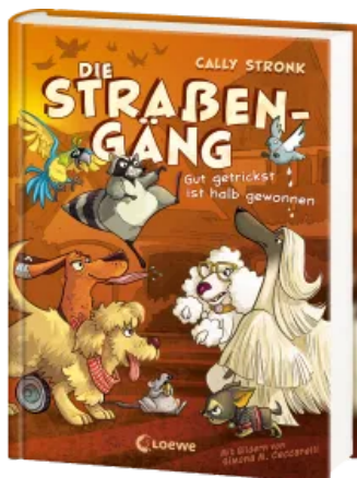
Die Straßengäng (Band 2) - Gut getrickst ist halb gewonnen Hardcover