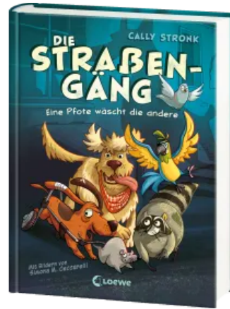
Die Straßengäng (Band 1) - Eine Pfote wäscht die andere Hardcover