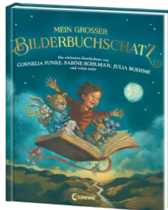
Mein großer Bilderbuchschatz Hardcover