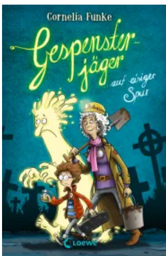
Gespensterjäger auf eisiger Spur (Band 1) Hardcover