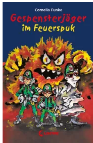
Gespensterjäger im Feuerspuk Hardcover