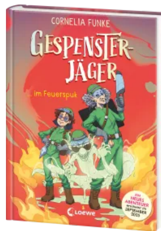
Gespensterjäger im Feuerspuk (Band 2) - Mit 8 neu illustrierten Farbseiten Hardcover