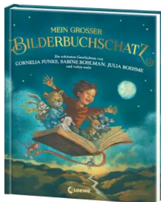
Mein großer Bilderbuchschatz Hardcover