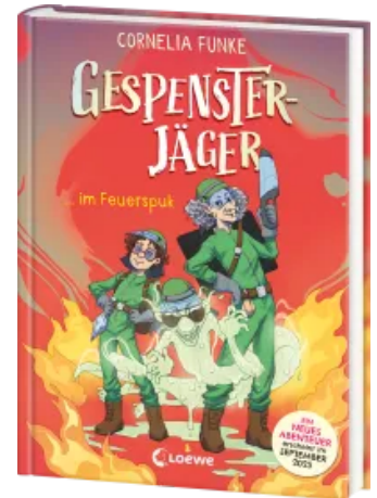
Gespenssterjäger im Feuerspek (Band 2) - Mit 8 neu illustrierten Farbseiten Hardcover