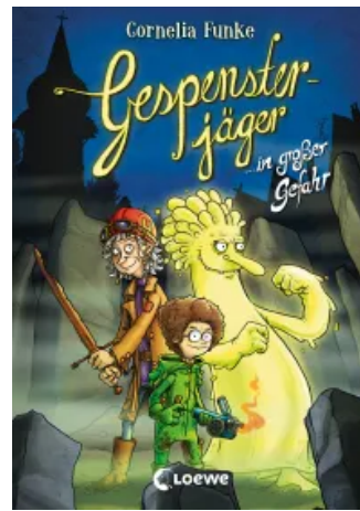
Gespensterjäger in großer Gefahr (Band 4) Hardcover