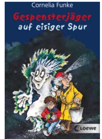
Gespensterjäger auf eisiger Spur Taschenbuch