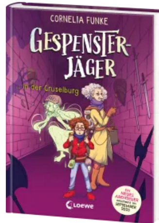
Gespenssterjäger in der Gruselburg (Band 3) - Mit 8 neu illustrierten Farbseiten Hardcover