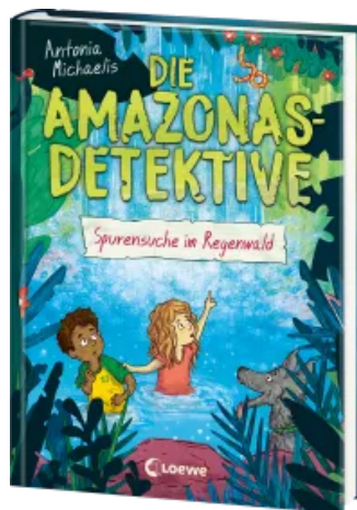
Die Amazonas-Detektive (Band 3) - Spurensuche im Regenwald Hardcover