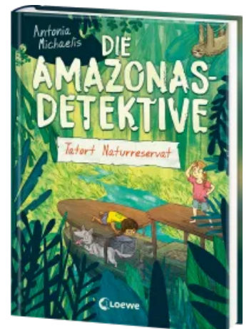
Die Amazonas-Detektive (Band 2) - Tatort Naturreservat Hardcover