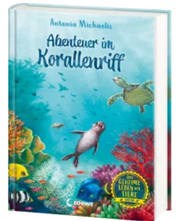
Das geheime Leben der Tiere (Ozean) - Abenteuer im Korallenriff Hardcover