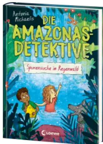
Die Amazonas-Detektive (Band 3) - Spurensuche im Regenwald Hardcover