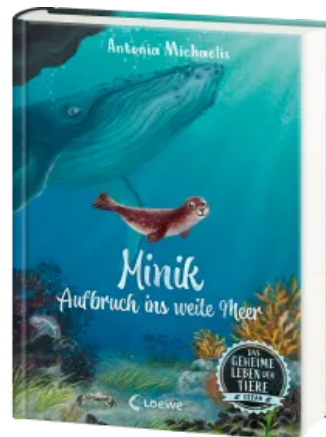
Das geheime Leben der Tiere (Ozean) - Minik - Aufbruch ins weite Meer Hardcover