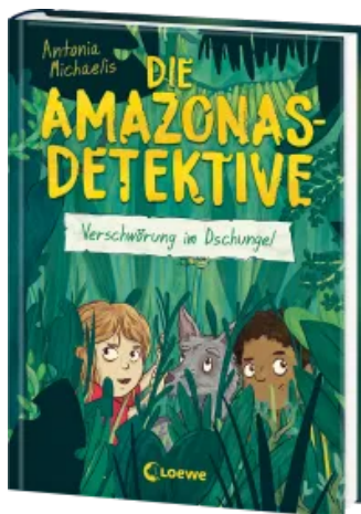
Die Amazonas-Detektive (Band 1) - Verschwörung im Dschungel Hardcover