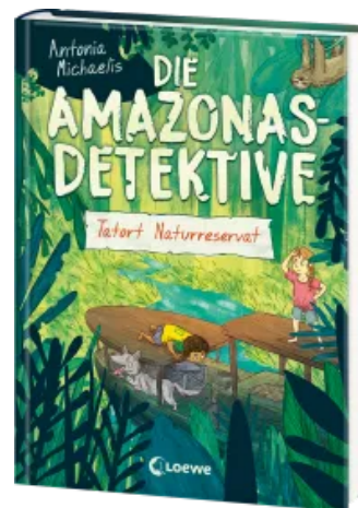
Die Amazonas-Detektive (Band 2) - Tatort Naturreservat Hardcover