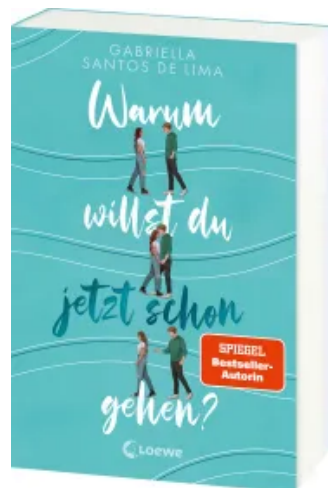
Warum willst du jetzt schon gehen? Paperback