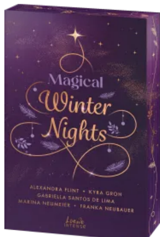
Magical Winter Nights Paperback