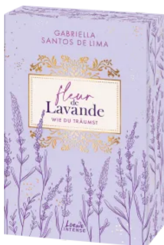
Fleur de Lavande (Band 3) - Wie du träumst Paperback