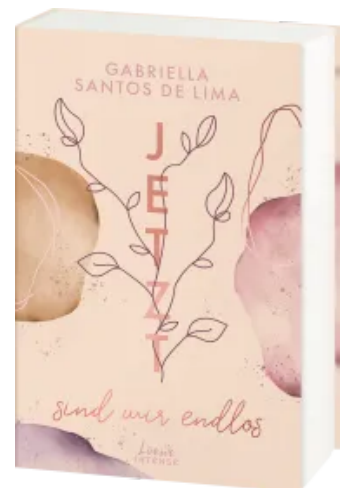
Jetzt sind wir endlos (Jetzt- Trilogie, Band 3) Paperback