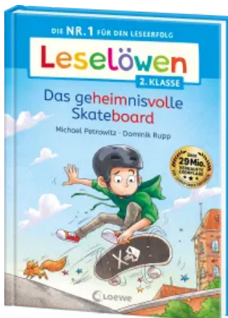
Leselöwen 2. Klasse - Das geheimnisvolle Skateboard Hardcover