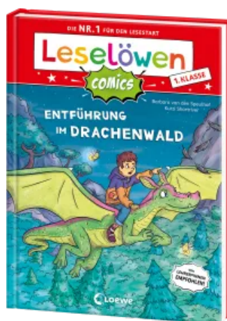
Leselöwen Comics 1. Klasse - Entführung im Drachenwald Hardcover