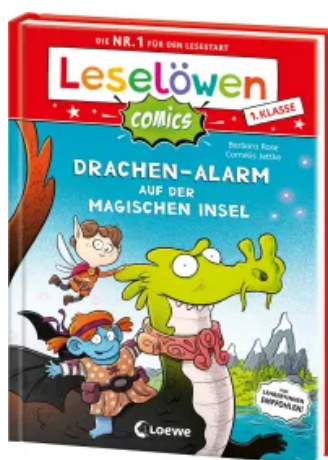
Leselöwen Comics 1. Klasse - Drachen-Alarm auf der magischen Insel Hardcover