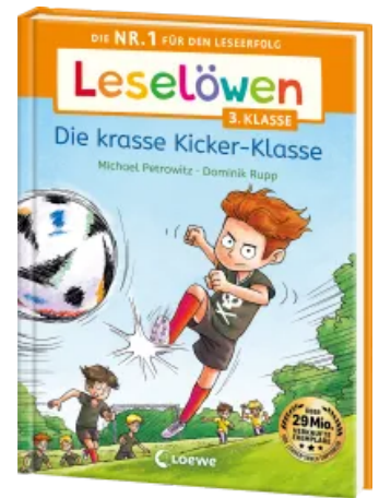
Leselöwen 3. Klasse - Die krasse Kicker-Klasse Hardcover