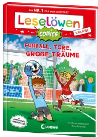
Leselöwen Comics 1. Klasse - Fußball, Tore, große Träume Hardcover