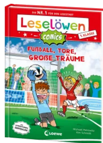
Leselöwen Comics 1. Klasse - Fußball, Tore, große Träume Hardcover