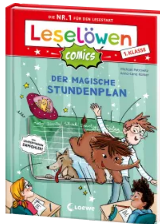
Leselöwen Comics 1. Klasse - Der magische Stundenplan Hardcover