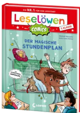
Leselöwen Comics 1. Klasse - Der magische Stundenplan Hardcover