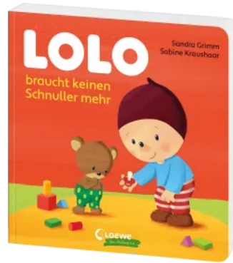
Lolo braucht keinen Schnuller mehr Hardcover