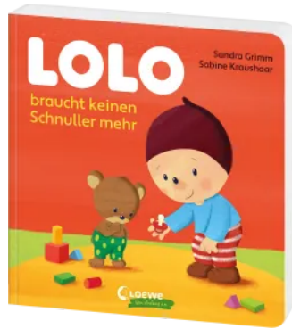
Lolo braucht keinen Schnuller mehr Hardcover