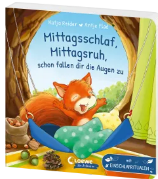
Mittagsschlaf, Mittagsruh, schon fallen dir die Augen zu Hardcover