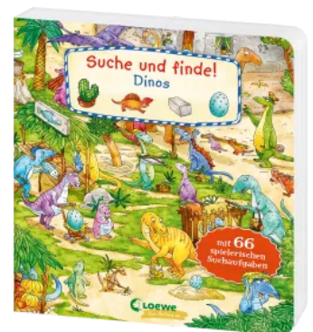
Suche und finde! - Dinos Hardcover