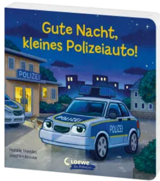
Gute Nacht, kleines Polizeiauto! Hardcover