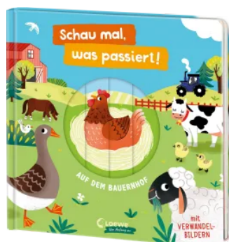
Schau mal, was passiert! Auf dem Bauernhof Hardcover