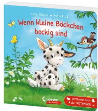
Wenn kleine Böckchen bockig sind Hardcover