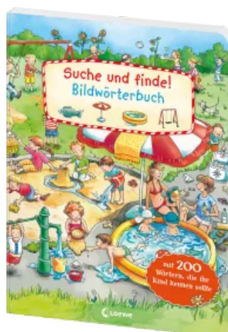
Suche und finde! -