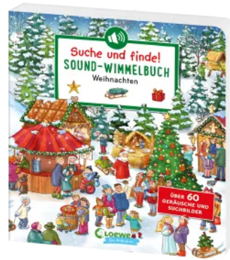
Suche und finde! Sound- Wimmelbuch - Weihnachten Hardcover