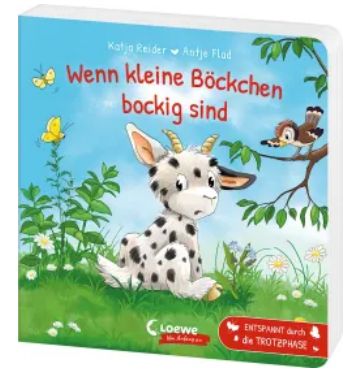
Wenn kleine Böckchen bockig sind Hardcover