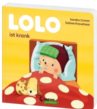
Lolo ist krank Hardcover