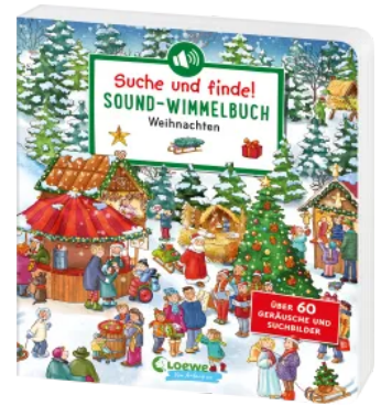
Suche und finde! Sound- Wimmelbuch - Weihnachten Hardcover