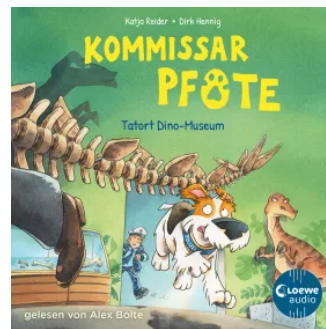
Kommissar Pfote (Band 9) - Tatort Dino-Museum Hörbuch