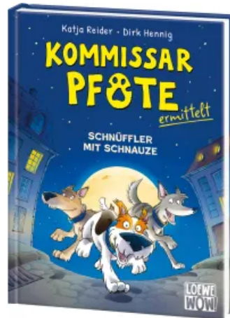
Kommissar Pfote ermittelt (Band 1) - Schnüffler mit Schnauze Hardcover