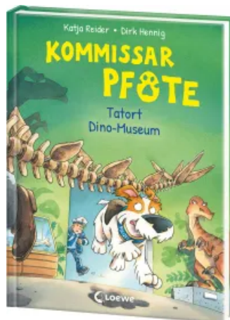
Kommissar Pfote (Band 9) - Tatort Dino-Museum Hardcover