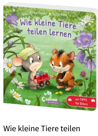
Wie kleine Tiere teilen lernen Hardcover