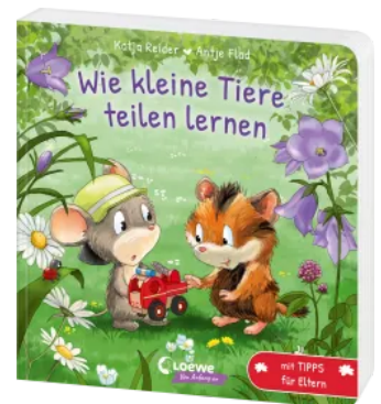
Wie kleine Tiere teilen lernen Hardcover