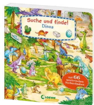
Suche und finde! - Dinos