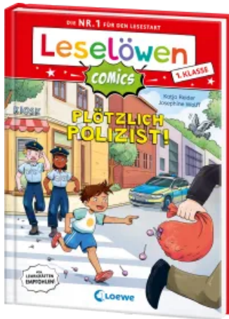
Leselöwen Comics 1. Klasse - Plötzlich Polizist! Hardcover