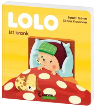
Lolo ist krank Hardcover