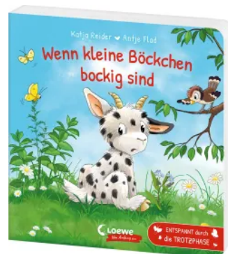
Wenn kleine Böckchen bockig sind Hardcover