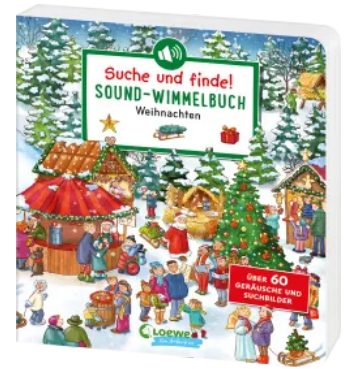
Suche und finde! Sound- Wimmelbuch - Weihnachten Hardcover