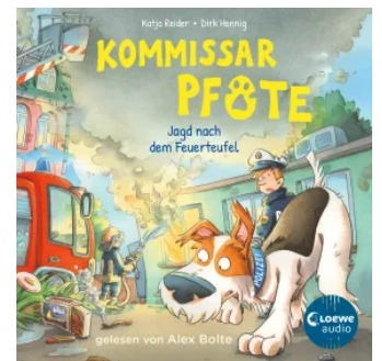
Kommissar Pfote (Band 8) - Jagd nach dem Feuerteufel Hörbuch