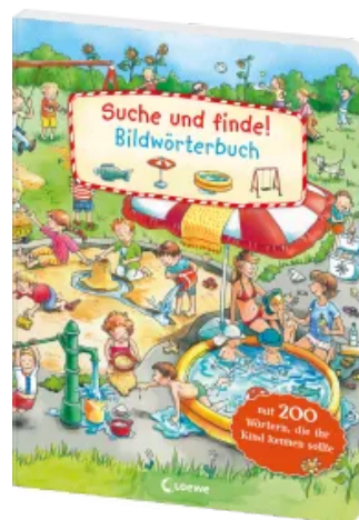
Suche und finde! - Bildwörterbuch Hardcover