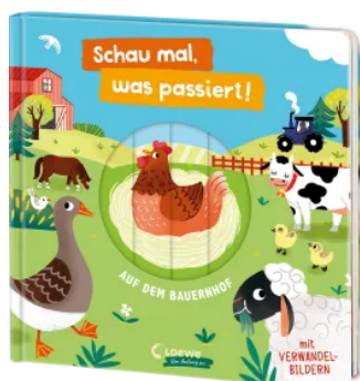
Schau mal, was passiert!