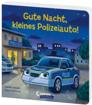
Gute Nacht, kleines Polizeiauto! Hardcover