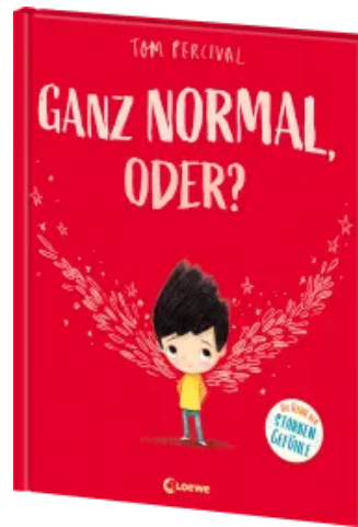
Ganz normal, oder? (Die Reihe der starken Gefühle) Hardcover