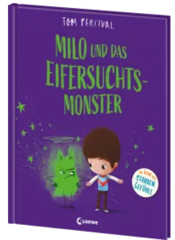
Milo und das Eifersuchtsmonster (Die Reihe der starken Gefühle) Hardcover