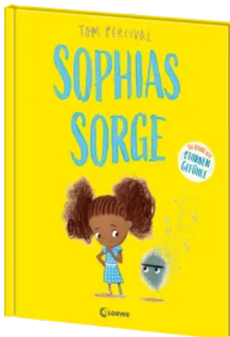
Sophias Sorge (Die Reihe der starken Gefühle) Hardcover