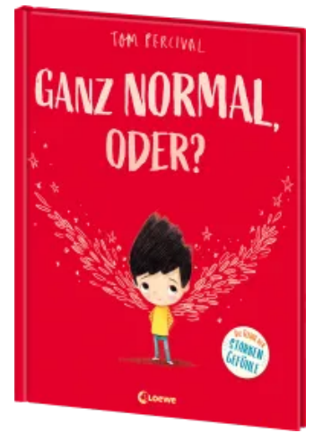
Ganz normal, oder? (Die Reihe der starken Gefühle) Hardcover