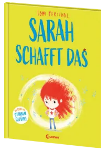
Sarah schafft das (Die Reihe der starken Gefühle) Hardcover