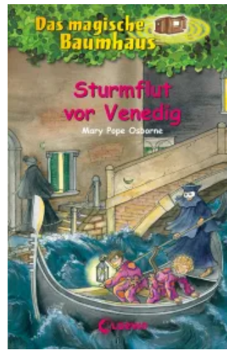
Das magische Baumhaus (Band 31) - Sturmflut vor Venedig Hardcover