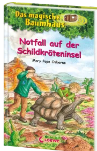
Das magische Baumhaus (Band 62) - Notfall auf der Schildkröteninsel Hardcover