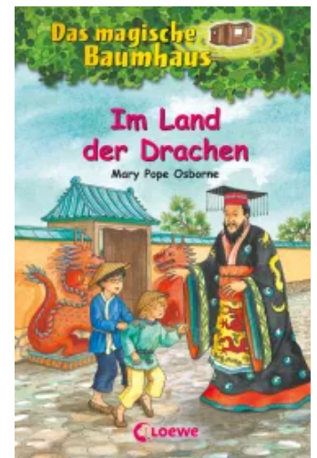
Das magische Baumhaus (Band 14) - Im Land der Drachen Hardcover