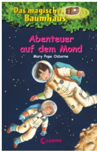
Das magische Baumhaus (Band 8) - Abenteuer auf dem Mond Hardcover