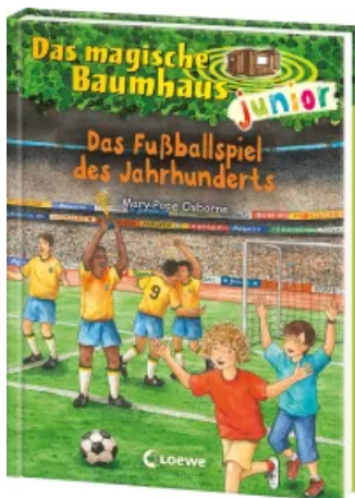
Das magische Baumhaus junior (Band 43) - Das Fußballspiel des Jahrhunderts Hardcover