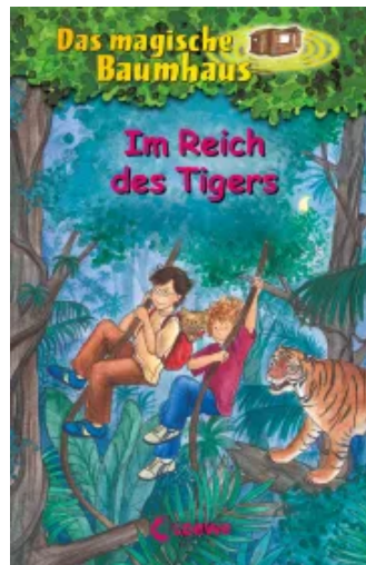
Das magische Baumhaus (Band 17) - Im Reich des Tigers Hardcover