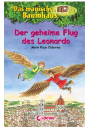
Das magische Baumhaus (Band 36) - Der geheime Flug des Leonardo Hardcover