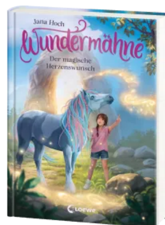
Wundermähne (Band 7) - Der magische Herzenswunsch Hardcover