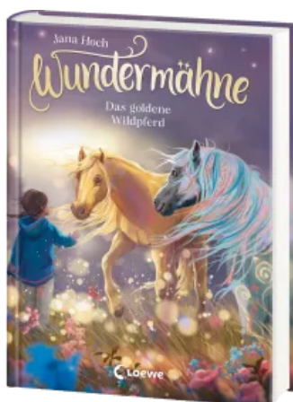
Wundermähne (Band 4) - Das goldene Wildpferd Hardcover