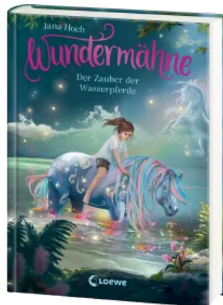
Wundermähne (Band 6) - Der Zauber der Wasserpferde Hardcover