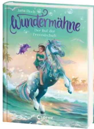
Wundermähne (Band 3) - Der Ruf der Freundschaft Hardcover