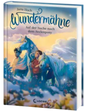
Wundermähne (Band 2) - Auf der Suche nach dem Seelenpony Hardcover