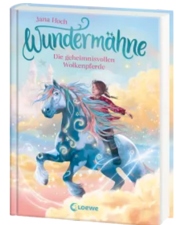
Wundermähne (Band 5) - Die geheimnisvollen Wolkenpferde Hardcover