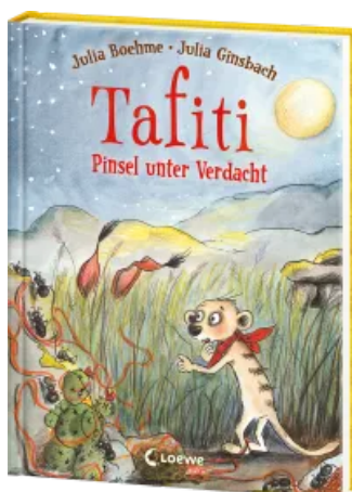
Tafiti (Band 22) - Pinsel unter Verdacht Hardcover