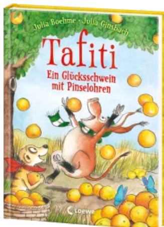
Tafiti (Band 24) - Ein Glücksschwein mit Pinselohren Hardcover