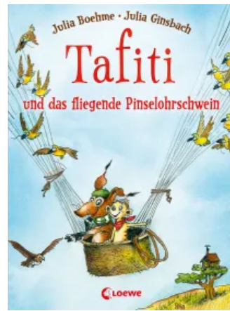
Tafiti und das fliegende Pinselohrschwein (Band 2) Hardcover