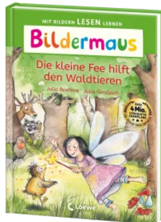
Bildermaus - Die kleine Fee hilft den Waldtieren Hardcover