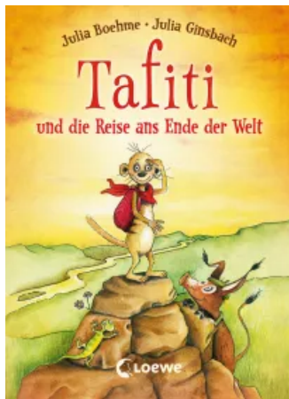
Tafiti und die Reise ans Ende der Welt (Band 1) Sonderausgabe