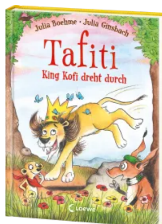
Tafiti - King Kofi dreht durch (Band 21) Hardcover