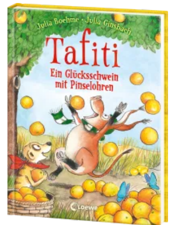
Tafiti (Band 24) - Ein Glücksschwein mit Pinselohren Hardcover