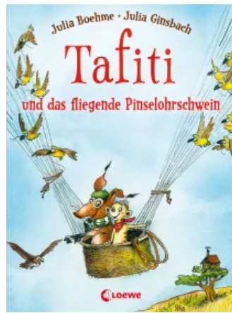
Tafiti und das fliegende Pinselohrschwein (Band 2) Hardcover