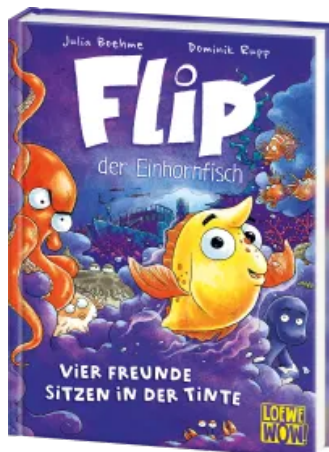
Flip, der Einhornfisch (Band 2) - Vier Freunde sitzen in der Tinte Hardcover