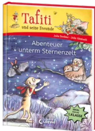
Tafiti und seine Freunde (Band 2) - Abenteuer unterm Sternenzelt Hardcover