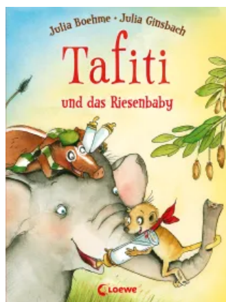
Tafiti und das Riesenbaby (Band 3) Hardcover

Tafiti und die Reise ans Ende der Welt (Band 1) Sonderausgabe