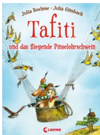
Tafiti und das fliegende Pinselohrschwein (Band 2) Hardcover