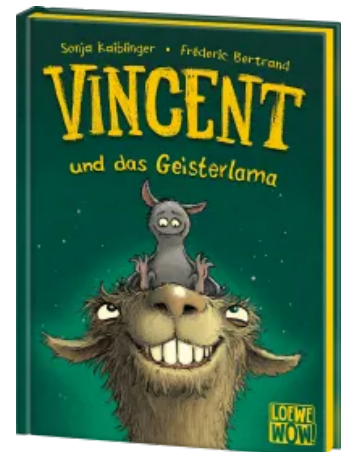
Vincent und das Geisterlama (Band 2) Hardcover