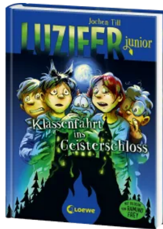
Luzifer junior (Band 15) - Klassenfahrt ins Geisterschloss Hardcover