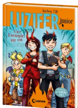
Luzifer junior (Band 17) - Vier Freunde für ein Hölleluja Hardcover