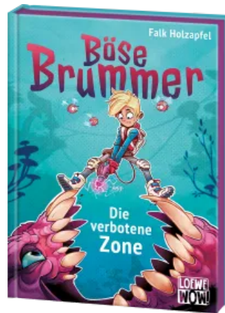
Böse Brummer (Band 1) - Die verbotene Zone Hardcover