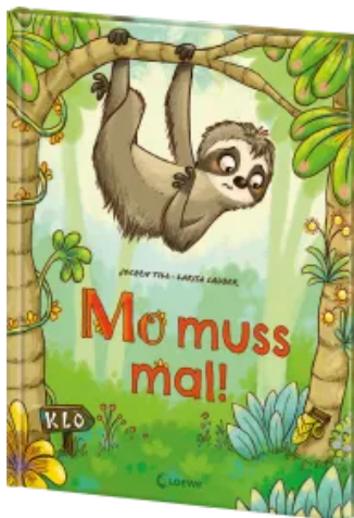
Mo muss mal! Hardcover