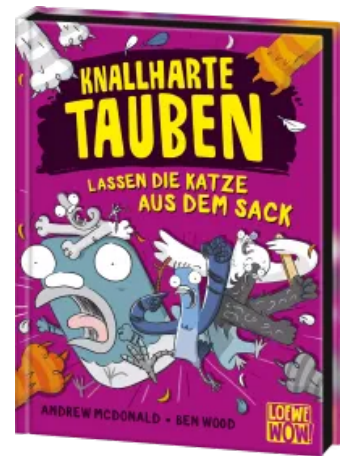
Knallharte Tauben lassen die Katze aus dem Sack (Band 5) Hardcover