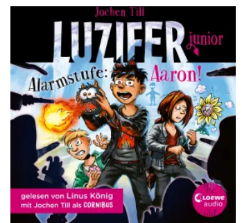
Luzifer junior (Band 16) - Alarmstufe: Aaron! Hörbuch