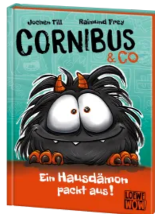
Cornibus & Co (Band 1) - Ein Hausdämon packt aus! Hardcover