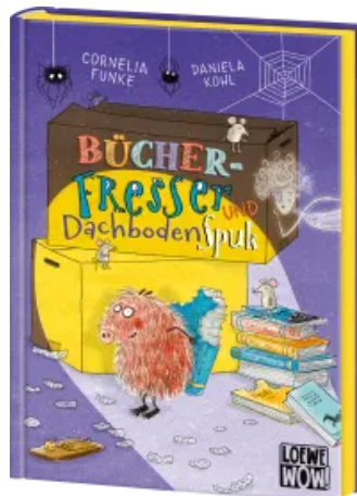
Bücherfresser und Dachbodenspuk Hardcover