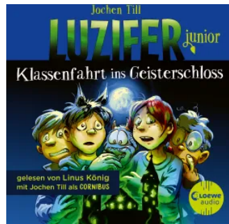
Luzifer junior (Band 15) - Klassenfahrt ins Geisterschloss Hörbuch