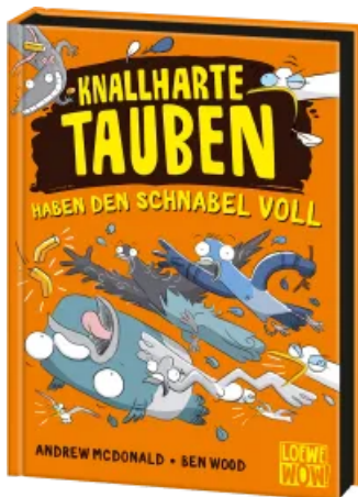
Knallharte Tauben haben den Schnabel voll (Band 4) Hardcover