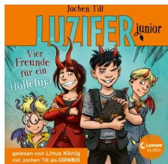
Luzifer junior (Band 17) - Vier Freunde für ein Hölleluja Hörbuch