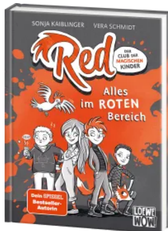
Red - Der Club der magischen Kinder (Band 1) - Alles im roten Bereich Hardcover