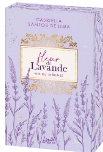
Fleur de Lavande (Band 3) - Wie du träumst Paperback