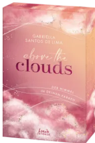
Above the Clouds (Band 1) - Der Himmel in deinen Farben Paperback