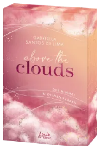
Above the Clouds (Band 1) - Der Himmel in deinen Farben Paperback