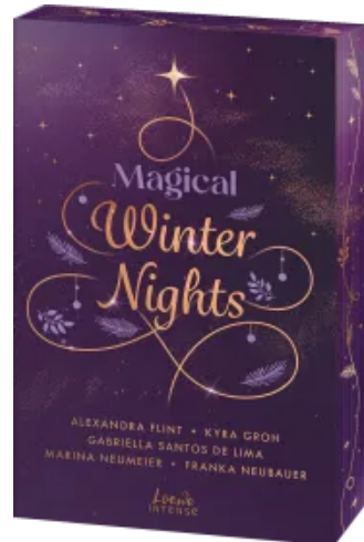
Magical Winter Nights Paperback