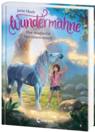
Wundermähne (Band 7) - Der magische Herzenswunsch Hardcover