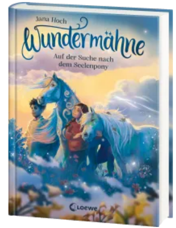
Wundermähne (Band 2) - Auf der Suche nach dem Seelenpony Hardcover