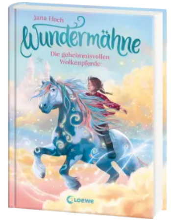
Wundermähne (Band 5) - Die geheimnisvollen Wolkenpferde Hardcover