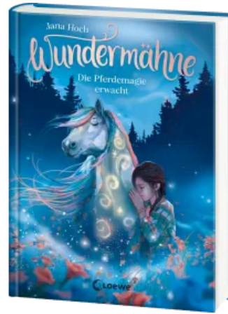
Wundermähne (Band 1) - Die Pferdemaie erwacht Hardcover