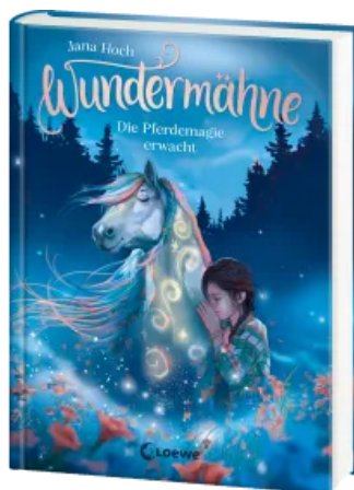
Wundermähne (Band 1) - Die Pferdemagie erwacht Hardcover