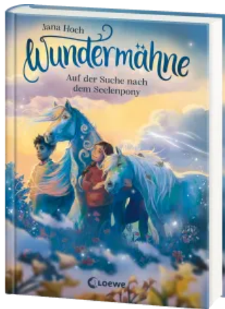
Wundermähne (Band 2) - Auf der Suche nach dem Seelenpony Hardcover