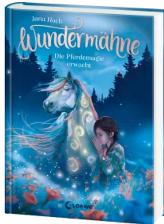
Wundermähe (Band 1) - Die Pferdemaie erwacht Hardcover