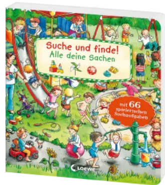
Suche und finde! - Alle deine Sachen Hardcover