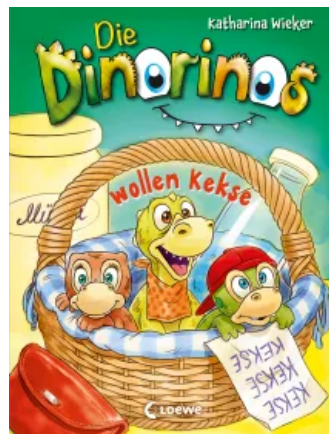
Die Dinorinos wollen Kekse (Band 2)