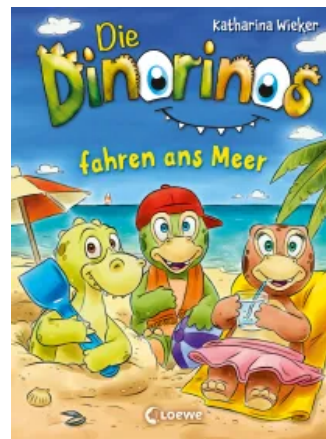
Die Dinorinos fahren ans Meer (Band 4)