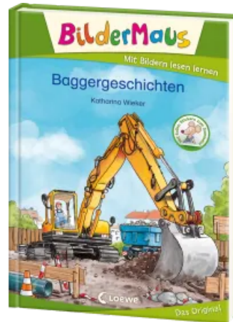
Bildermaus - Baggergeschichten Hardcover