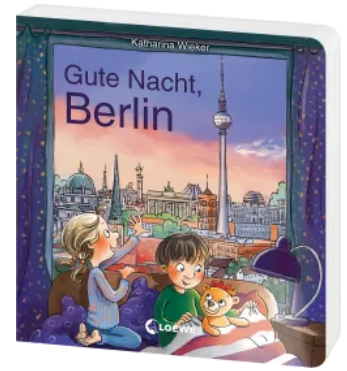
Gute Nacht, Berlin Hardcover