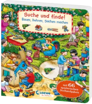
Suche und finde! Bauen, bohren, Sachen machen Hardcover