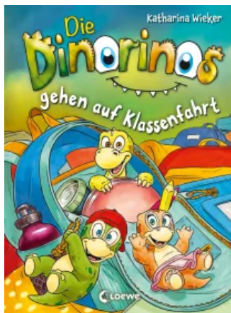
Die Dinorinos gehen auf Klassenfahrt (Band 5)