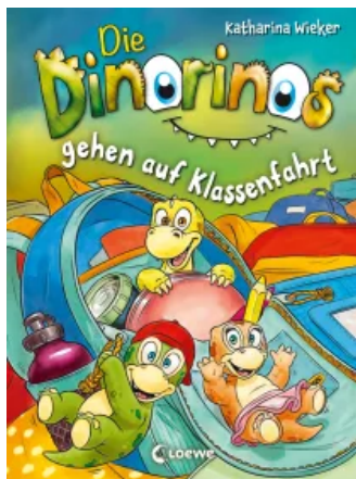
Die Dinorinos gehen auf Klassenfahrt (Band 5)