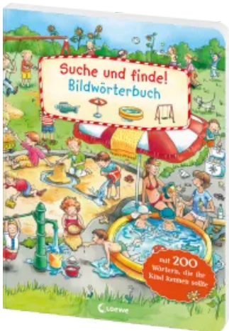
Suche und finde! - Bildwörterbuch Hardcover