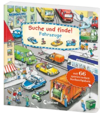
Suche und finde! - Fahrzeuge Hardcover