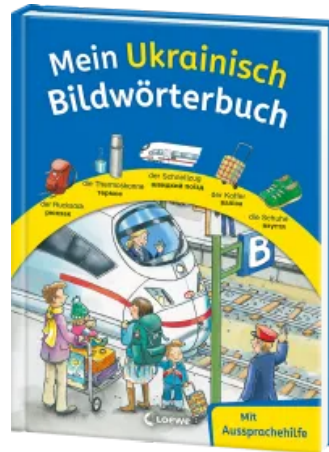
Mein Ukrainisch Bildwörterbuch Hardcover