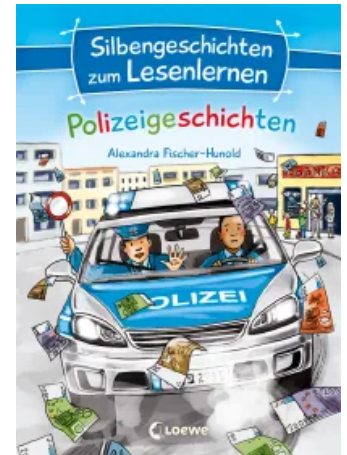
Silbengeschichten zum Lesenlernen - Polizeigeschichten Hardcover