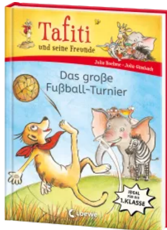
Tafiti und seine Freunde (Band 1) - Das große Fußball-Turnier Hardcover