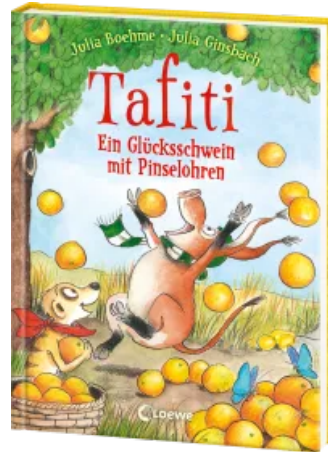
Tafiti (Band 24) - Ein Glücksschwein mit Pinselohren Hardcover