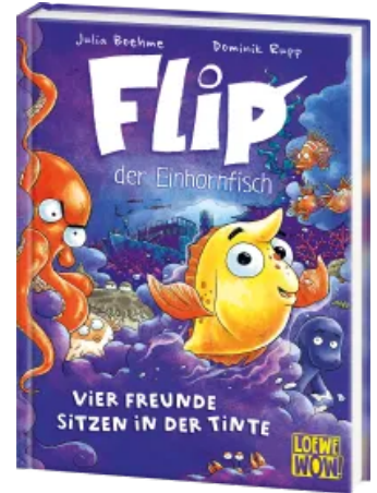
Flip, der Einhornfisch (Band 2) - Vier Freunde sitzen in der Tinte Hardcover