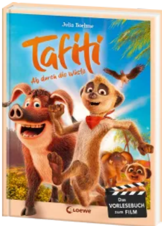
Tafiti - Ab durch die Wüste Hardcover