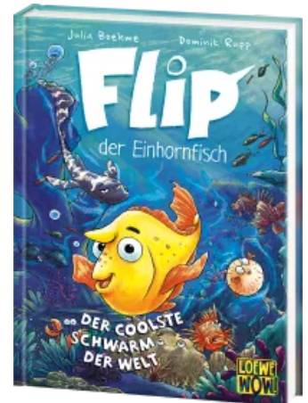
Flip, der Einhornfisch (Band 1) - Der coolste Schwarm der Welt Hardcover