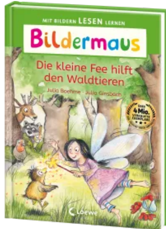
Bildermaus - Die kleine Fee hilft den Waldtieren Hardcover