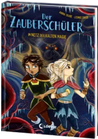
Der Zauberschüler (Band 8) - Im Netz der kalten Magie Hardcover