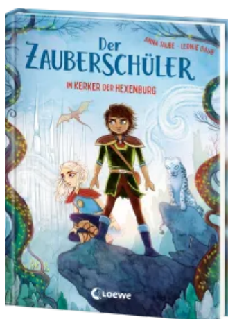
Der Zauberschüler (Band 5) - Im Kerker der Hexenburg Hardcover