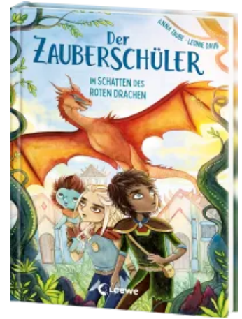
Der Zauberschüler (Band 3) - Im Schatten des roten Drachen Hardcover