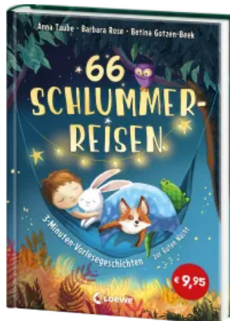
66 Schlummerreisen - 3- Minuten- Vorlesegeschichten zur Guten Nacht Hardcover