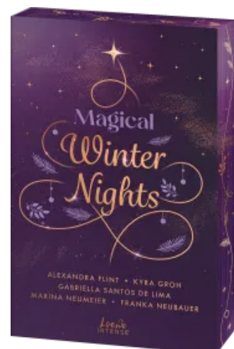
Magical Winter Nights Paperback