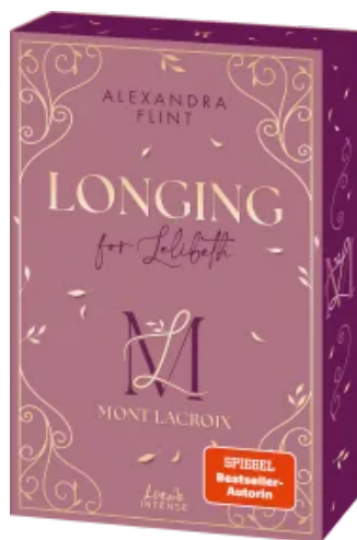
Mont Lacroix (Band 1) - Longing for Lelibeth Paperback