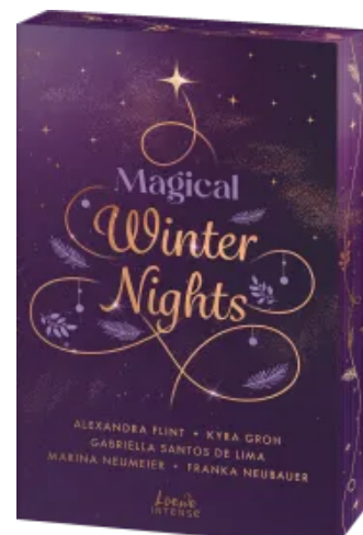
Magical Winter Nights Paperback