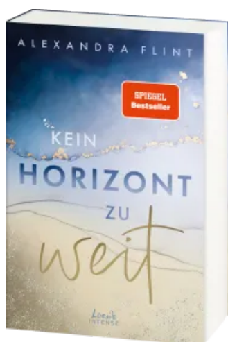
Kein Horizont zu weit (Tales of Sylt, Band 1) Paperback