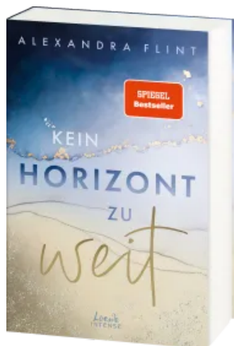
Kein Horizont zu weit (Tales of Sylt, Band 1)