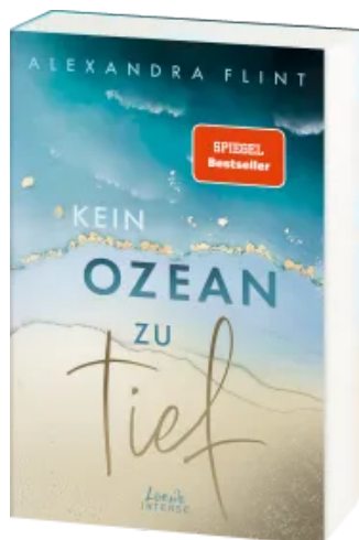
Kein Ozean zu tief (Tales of Sylt, Band 3)