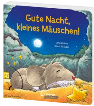
Gute Nacht, kleines Mäuschen! Hardcover