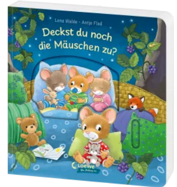
Deckst du noch die Mäuschen zu? Hardcover