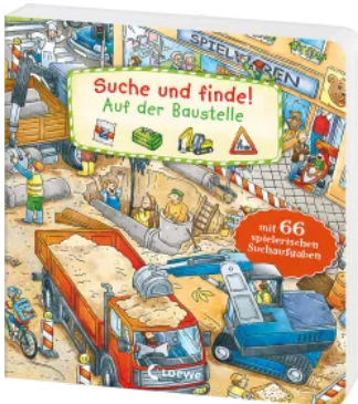
Suche und finde! - Auf der Baustelle Hardcover