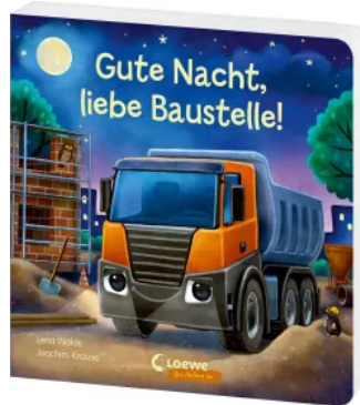
Gute Nacht, liebe Baustelle! Hardcover