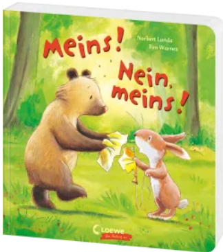
Meins! Nein, meins! Hardcover