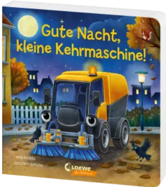
Gute Nacht, kleine Kehrmaschine! Hardcover