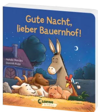
Gute Nacht, lieber Bauernhof!