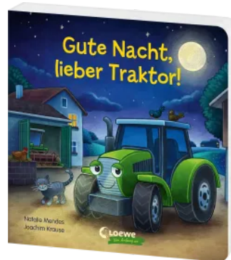
Gute Nacht, lieber Traktor! Hardcover