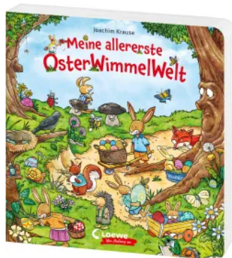
Meine allererste OsterWimmelWelt