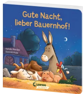
Gute Nacht, lieber Bauernhof! Hardcover