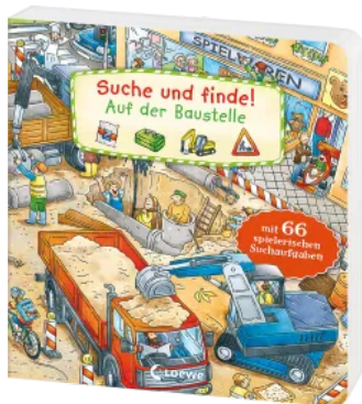
Suche und finde! - Auf der Baustelle