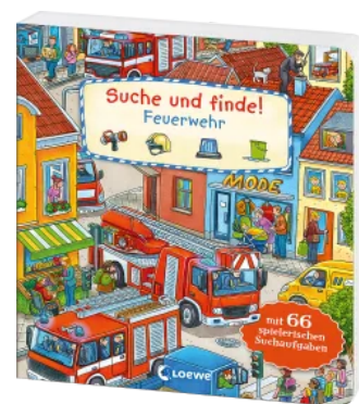
Suche und finde! -