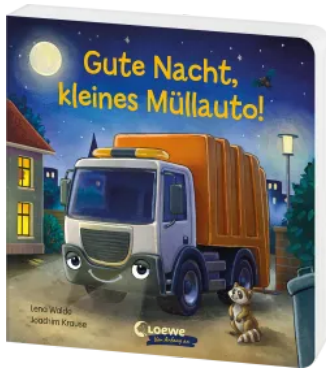
Gute Nacht, kleines Müllauto! Hardcover