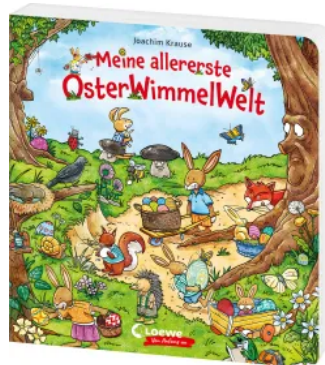
Meine allererste OsterWimmelWelt Hardcover