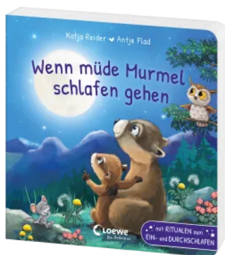
Wenn müde Murrel schlafen gehen