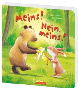
Meins! Nein, meins!