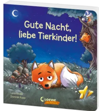
Gute Nacht, liebe Tierkinder! Hardcover