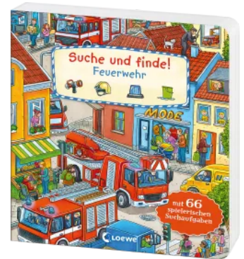
Suche und finde! - Feuerwehr Hardcover