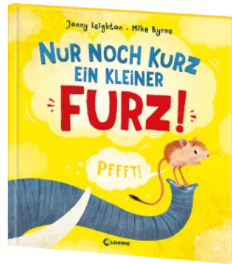
Nur noch kurz ein kleiner Furz! Hardcover