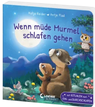
Wenn müde Murrel schlafen gehen Hardcover