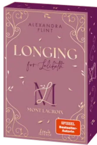
Mont Lacroix (Band 1) - Longing for Lelibeth Paperback