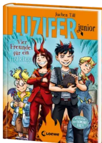
Luzifer junior (Band 17) - Vier Freunde für ein Hölleluja Hardcover