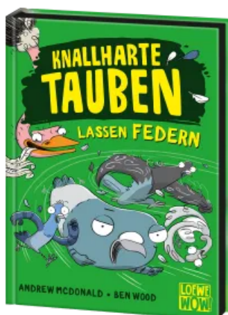
Knallharte Tauben lassen Federn (Band 2) Hardcover