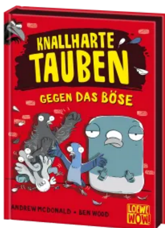
Knallharte Tauben gegen das Böse (Band 1) Hardcover