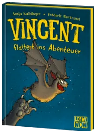
Vincent flattert ins Abenteuer (Band 1) Hardcover