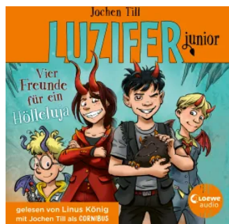
Luzifer junior (Band 17) - Vier Freunde für ein Hölleluja Hörbuch