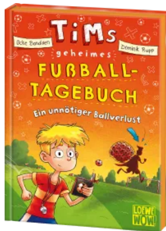
Tims geheimes Fußball- Tagebuch (Band 2) - Ein unnötiger Ballverlust Hardcover