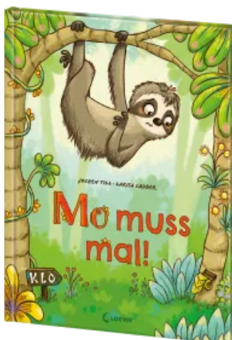
Mo muss mal! Hardcover