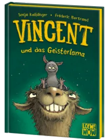
Vincent und das Geisterlama (Band 2) Hardcover