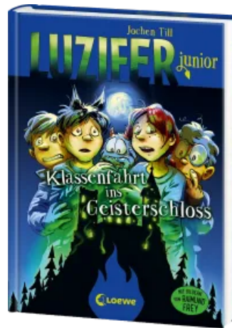
Luzifer junior (Band 15) - Klassenfahrt ins Geisterschloss Hardcover