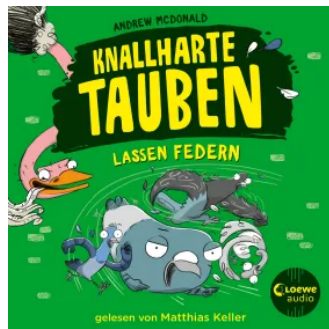
Knallharte Tauben lassen Federn (Band 2) Hörbuch