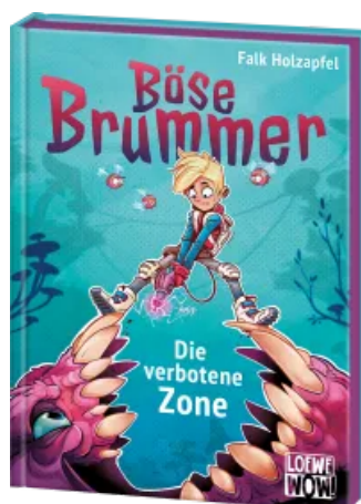
Böse Brummer (Band 1) - Die verbotene Zone Hardcover