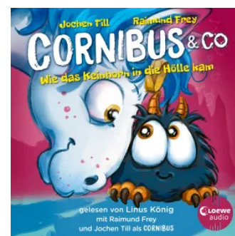
Cornibus & Co. (Band 4) - Wie das Keinhorn in die Hölle kam Hardcover