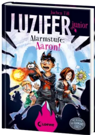
Luzifer junior (Band 16) - Alarmstufe: Aaron! Hardcover