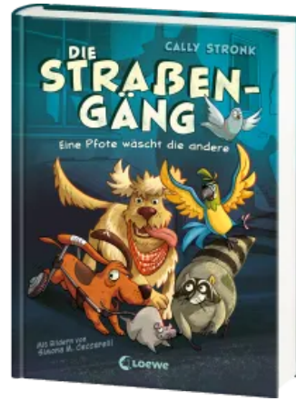
Die Straßengäng (Band 1) - Eine Pfote wäscht die andere Hardcover