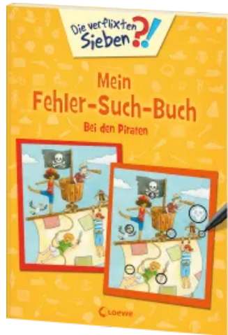
Die verflixten Sieben - Mein Fehler-Such-Buch - Bei den Piraten Taschenbuch