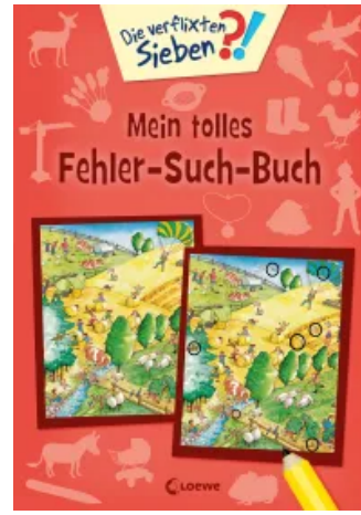
Die verflixten Sieben - Mein tolles Fehler-Such-Buch Taschenbuch