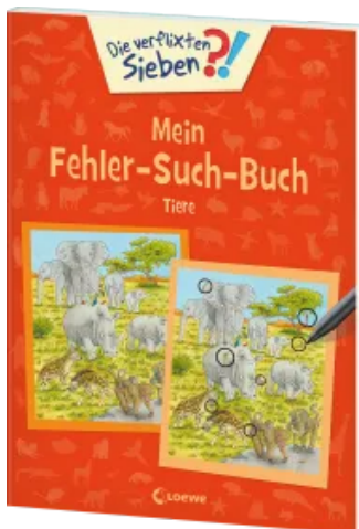
Die verflixten Sieben - Mein Fehler-Such-Buch - Tiere Taschenbuch