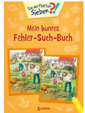
Die verflixten Sieben - Mein buntes Fehler-Such-Buch Taschenbuch