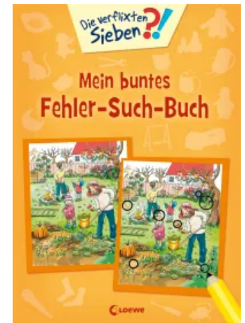
Die verflixten Sieben - Mein buntes Fehler-Such-Buch Taschenbuch