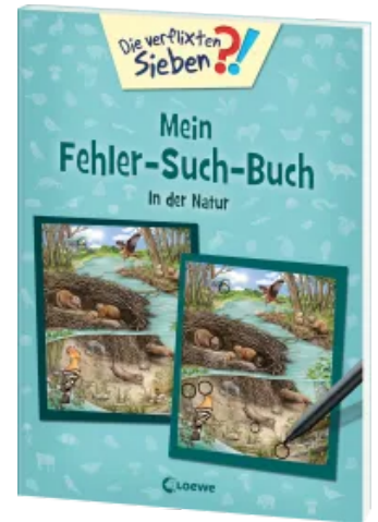
Die verflixten Sieben - Mein Fehler-Such-Buch - In der Natur Taschenbuch