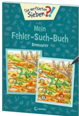
Die verflixten Sieben - Mein Fehler-Such-Buch - Dinosaurier Taschenbuch