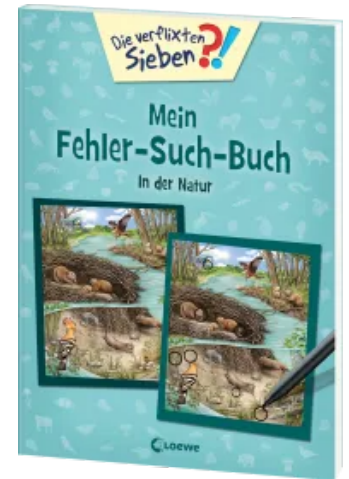
Die verflixten Sieben - Mein Fehler-Such-Buch - In der Natur Taschenbuch