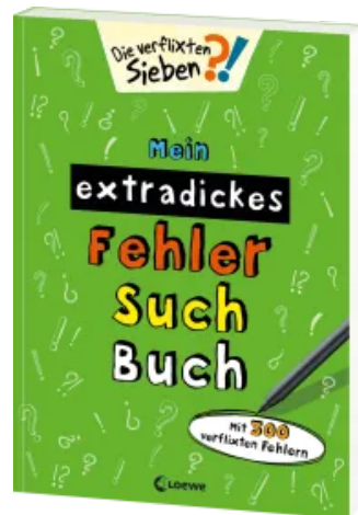
Mein extradickes Fehler-Such-Buch (grün) Taschenbuch