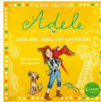
Adele und das Haustiergeheimnis Hörbuch