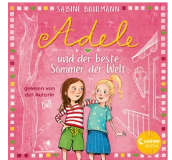
Adele und der beste Sommer der Welt Hörbuch