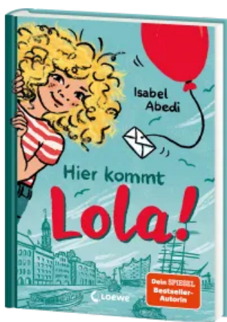
Hier kommt Lola! (Band 1) Hardcover