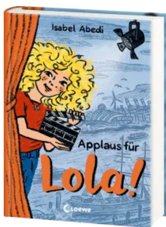
Applaus für Lola! (Band 4) Hardcover