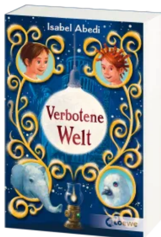
Verbotene Welt Taschenbuch