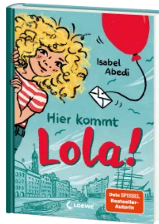
Hier kommt Lola! (Band 1) Hardcover