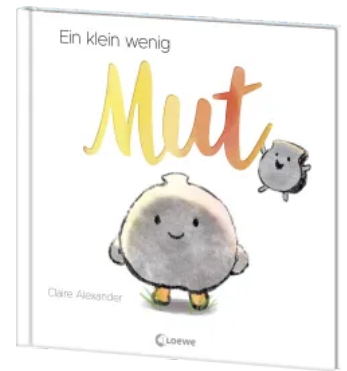
Ein klein wenig Mut Hardcover