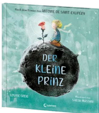
Der kleine Prinz Hardcover