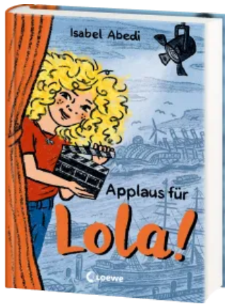
Applaus für Lola! (Band 4) Hardcover