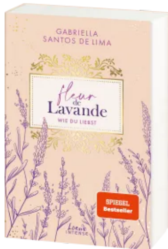
Fleur de Lavande (Band 1) - Wie du liebst Paperback