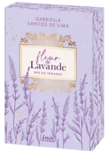
Fleur de Lavande (Band 3) - Wie du träumst Paperback