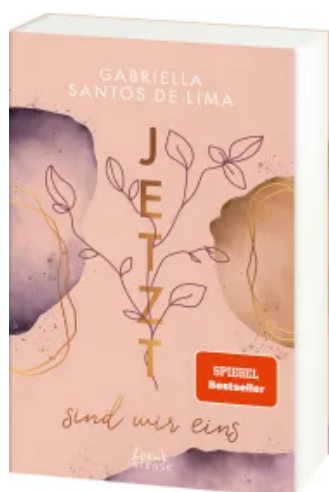
Jetzt sind wir eins (Jetzt-Trilogie, Band 2)