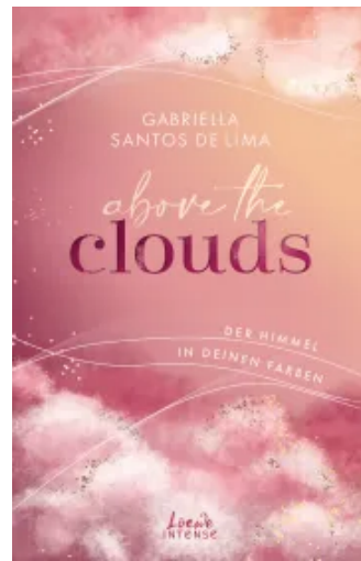
Above the Clouds (Band 1) - Der Himmel in deinen Farben Paperback