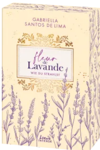
Fleur de Lavande (Band 2) - Wie du strahlst Paperback