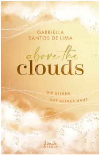
Above the Clouds (Band 3) - Die Sterne auf deiner Haut Paperback