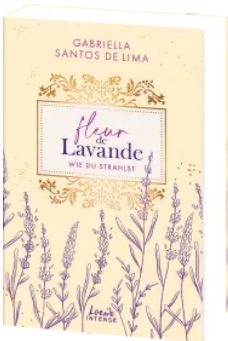
Fleur de Lavande (Band 2) - Wie du strahlst Paperback