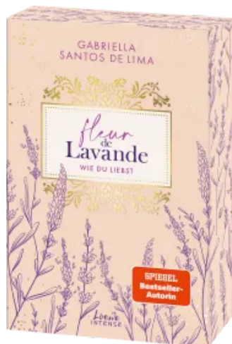
Fleur de Lavande (Band 1) - Wie du liebst Paperback