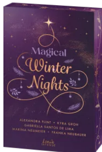
Magical Winter Nights Paperback