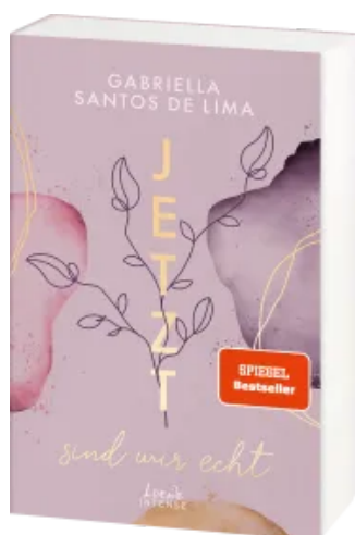
Jetzt sind wir echt (Jetzt-Trilogie, Band 1)