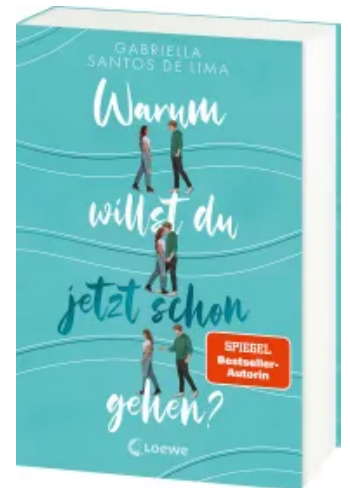
Warum willst du jetzt schon gehen? Paperback