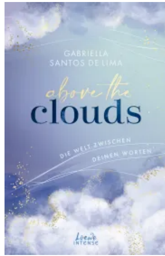
Above the Clouds (Band 2) - Die Welt zwischen deinen Worten Paperback