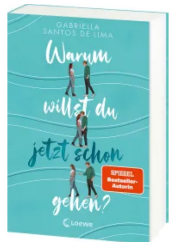
Warum willst du jetzt schon gehen? Paperback