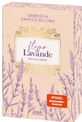
Fleur de Lavande (Band 1) - Wie du liebst Paperback