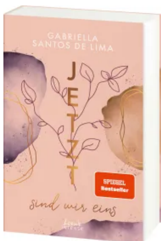
Jetzt sind wir eins (Jetzt-Trilogie, Band 2)