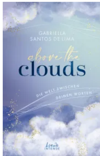
Above the Clouds (Band 2) - Die Welt zwischen deinen Worten Paperback