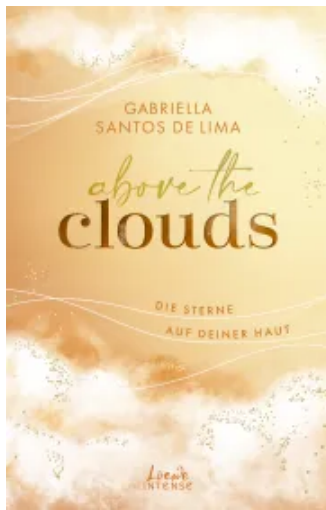
Above the Clouds (Band 3) - Die Sterne auf deiner Haut Paperback