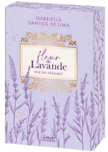
Fleur de Lavande (Band 3) - Wie du träumst Paperback