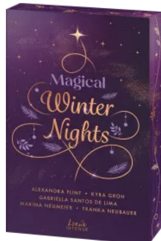
Magical Winter Nights Paperback