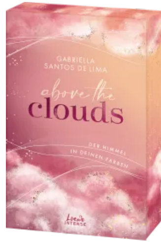
Above the Clouds (Band 1) - Der Himmel in deinen Farben Paperback