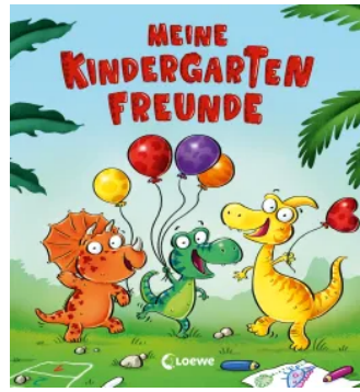
Meine Kindergarten- Freunde (Dino) Hardcover