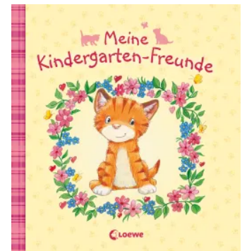
Meine Kindergarten- Freunde (Kätzchen) Hardcover