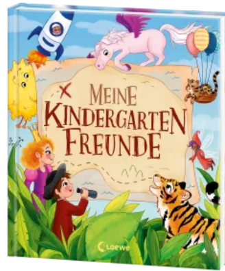
Meine Kindergarten- Freunde (Magische Wesen, Tiere & Co.) Hardcover