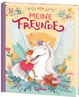
Meine Freunde (Einhorn, Feen & Co.) Hardcover