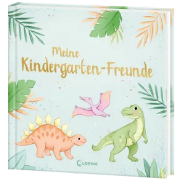
Meine Kindergarten- Freunde (neu) - Dinosaurier Hardcover