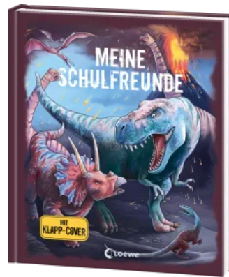
Meine Schulfreunde (Dinosaurier) Hardcover